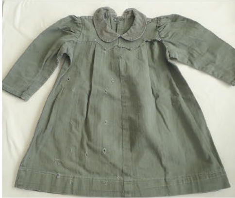
▲HBT (アメリカ軍服) のリメイクワンピース