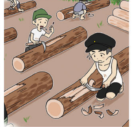
▲松の木の皮はぎの様子 (イメージ)