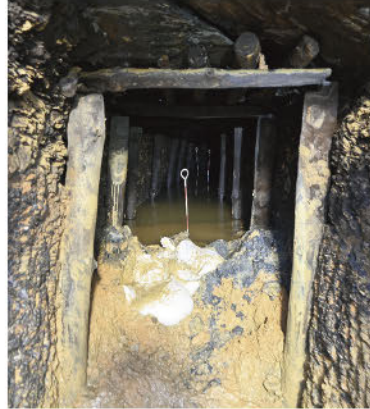
▲真栄田塩屋原の壕跡