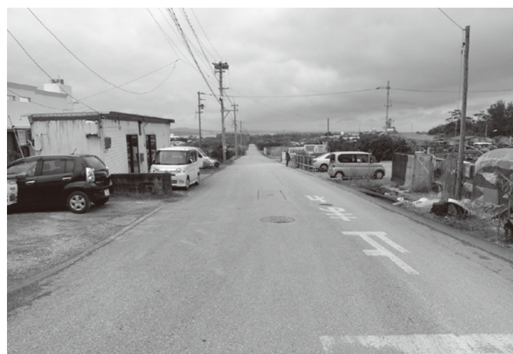
勢高2号線 (土地改良区)

答 勢高2号線土地改良区の分、延長570m地権者39名42筆、2557㎡の分筆登記業務である。