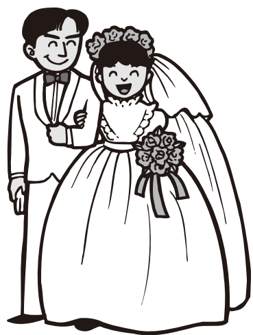
結婚新生活支援事業補助金2,400千円

答 車の状況等で廃車にするか、修理するか、新車を購入するか判断した。年明けにコミュニティーセンターで大