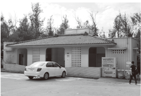
老朽化している万座毛のトイレ

今後また、村を訪れる来訪者が気持ち良く村内で過ごせ、再び訪問して頂けるよう整備したいと思っております。