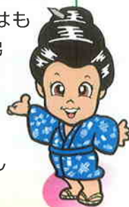
情熱の歌人 うんなナビ