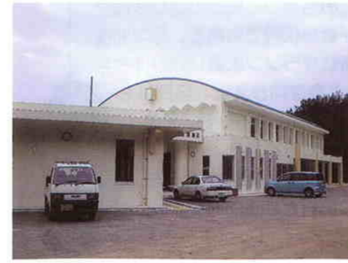
谷茶交流施設 (終了)