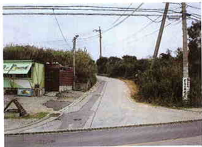
上水道施設 (富里原)