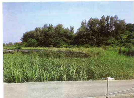
山田地区污水处理場予定地 (塩屋)