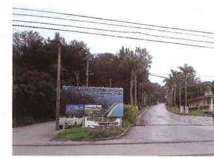
村道76号 大袋原線整備