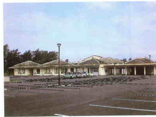
体験学習センター (終了)