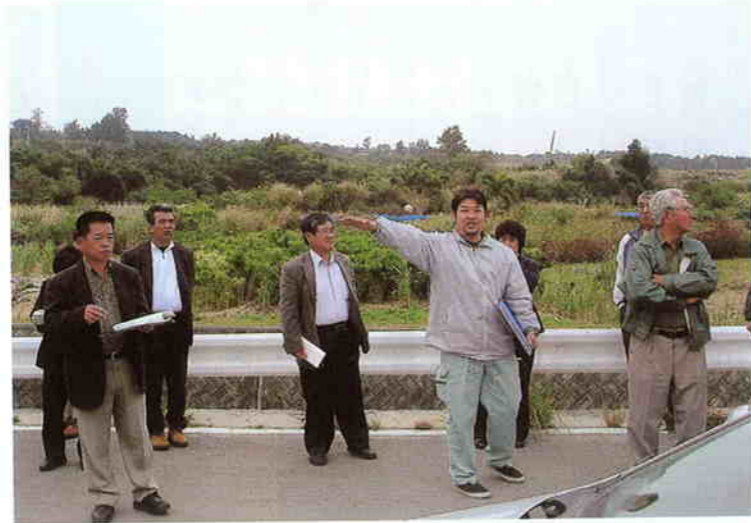
踏査状況 (污水处理場)