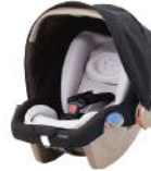
チャイルドシート