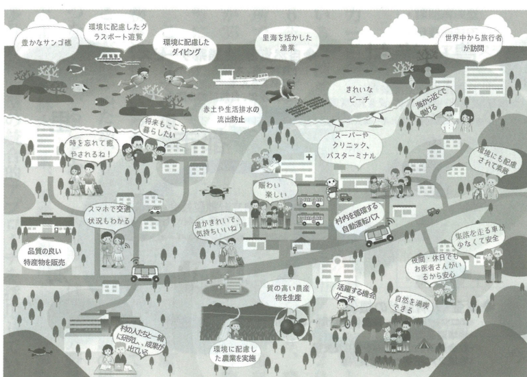
恩納村2030年のあるべき姿

Green Fins（グリーンフィンズ）とはUNEP（国連環境計画）が定めた自然環境に配慮したダイビングやシュノーケリングのガイドライン。これまでは、環境と経済の課題を中心に取り組んできましたが、今後は社会面などの村民の生活課題に裨益する取り組みを充実させていきたいと考えています。世界「サンゴと人にやさしい村」を目指していくうえで、村民の生活が豊かになれば、より多くの村民に自然環境を保全することや経済を循環させる意義が伝わり、誰一人取り残さない世界「サンゴと人にやさしい村」が実現できるのではないかと思っています。その他、定住関係の整備等、住みよい村にするための具体的な課題にどう取り組んでいくか、行政、村民、事業者が一体となって、あるべき姿の実現に向けた村づくりに取り組んでいきたいと思っています。