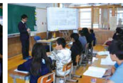
職業人講話・マナー講座