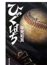
「ひやくはち」 早見和真