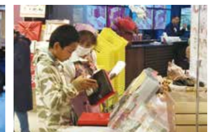
ジョブシャドウイング