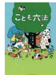
「こども六法」 山崎聡一郎