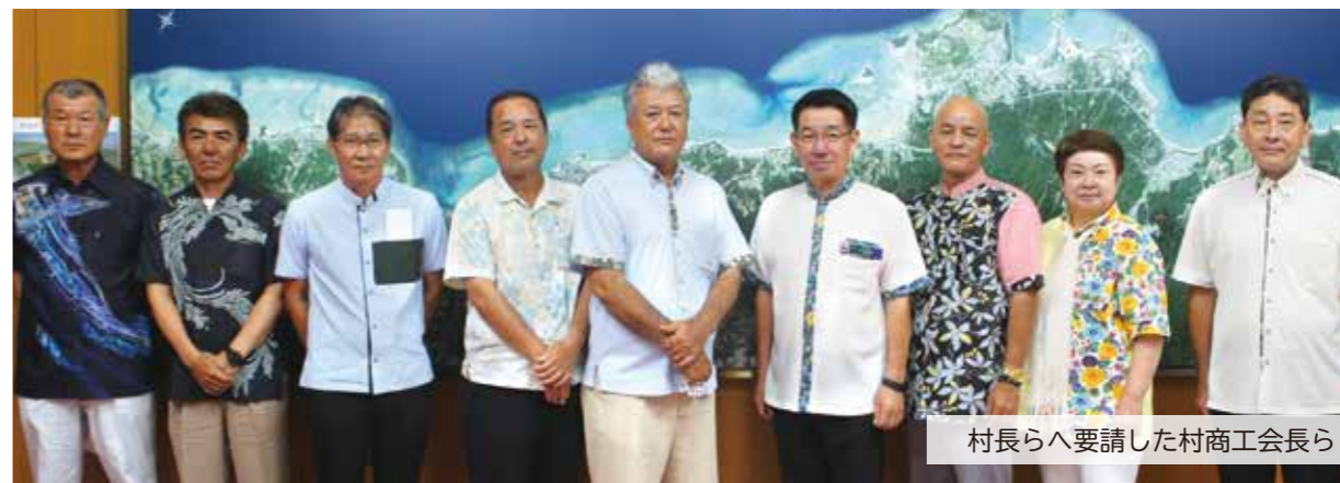
村長らへ要請した村商工会長ら

沖縄県では、毎年7月を「県産品奨励月間」として、県内において県産品の使用奨励と需要拡大を目的に、各種の奨励運動を実施しております。