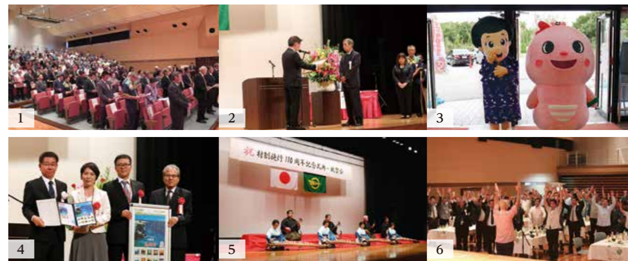
1_村歌斉唱 2_表彰状贈呈 3_ナピーちゃん、sunnaちゃんもお祝いに 4_恩納村記念切手贈呈 5_祝賀会幕開け 6_万歳三唱で節目を祝う