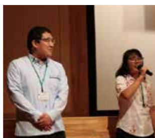
村制施行110周年記念式典・祝賀会に出席