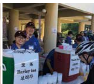
ツール・ド・おきなわのお手伝い