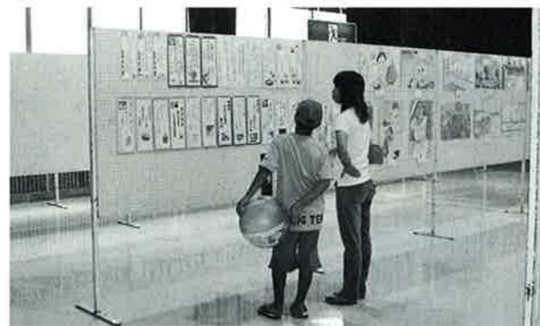
▲小・中学校作品展示