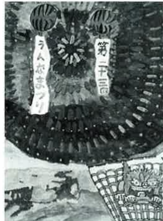
登川 勇 (安富祖小6年)