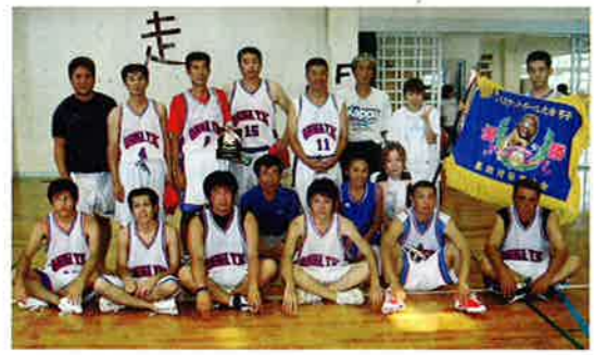
▲男子優勝、恩納体協のみなさん