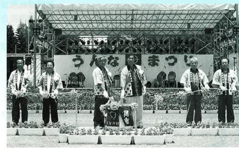
▲開会のテープカットを行う関係者みなさん