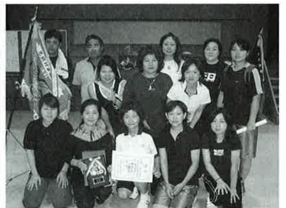
▲女子の部で優勝した前兼久体協チーム

第32回恩納村各字対抗卓球大会は6月25日、村コミュニティセンターで男子9チーム、女子7チームが参加して熱い戦いを繰りひろげました。 男子の部の決勝は、仲泊体協対瀬良垣体協の対戦となり、4対3の接戦の末、仲泊体協が勝利し4年連続27回目の優勝となりました。女子の部は、昨年の大会と同じ対戦で前兼久体協と仲泊体協が決勝に勝ち上がり、前兼久体協が去年の雪辱を果たし2年ぶり2回目の優勝を飾りました。 成績は、次のとおりです。