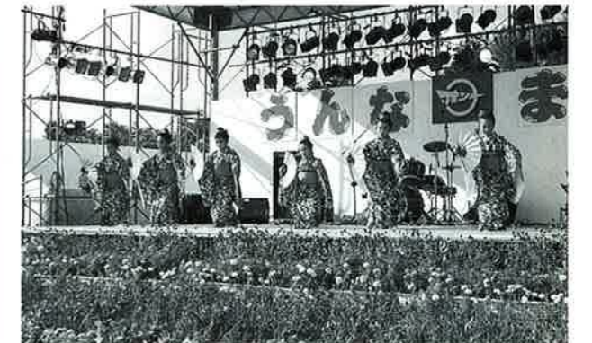
▲かわいらしい子どもたちの演舞