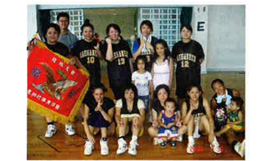
▲4連覇を果たした前兼久体協のみなさん