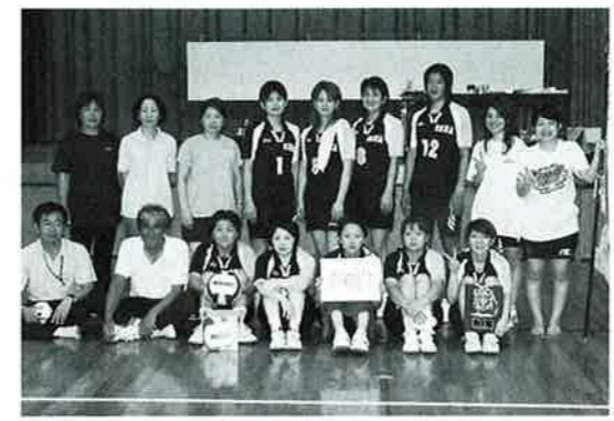
▲優勝した恩納体協女子のみなさん