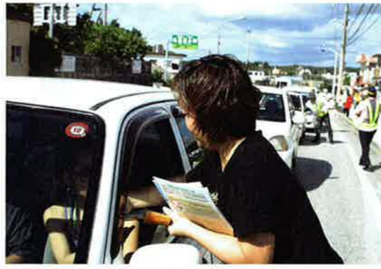
▲飲酒運転の撲滅を訴える交通安全母の会