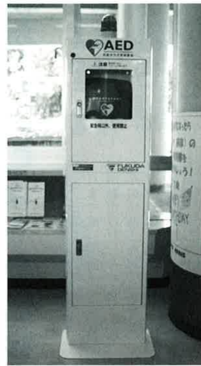
▶村役場に設置されたAEDボックス

日本では心室細動(心臓の痙攣状態)により心臓が突然止まる「心臓突然死」が原因で、病院外で年間約3万人が命を奪われているといわれています。このような緊急時の心停止救命処置が行えるようにと7月27日、村内5校の小中学校と村役場庁舎内にAED(自動体外式除細動器)を設置しました。AEDとは、Automated External Defibrillator(自動体外除細動器)の略で、電源を入れると音声で操作が指示され、救助者がそれに従って除細動(心臓に電気ショックを与えること)を行う装置です。今回の設置には7月26日に、仲泊小中学校で学校関係者と村役場関係者を集めて講習を終えていて、関係者は「AEDを設置したことで、多くの命を救う力になって欲しい」と述べていました。