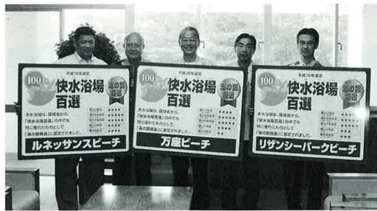
▲特選の選定書を手に喜ぶ関係者のみなさん

快水浴場百選とは環境省で行っている事業で、人が水に直接触れることの出来る個性ある水辺を評価し、これらの最適な水浴場を広く普及することを目的として、全国100カ所の水浴場を選んでいます。また、特に優れた12カ所の水浴場(海の部10、島の部1)を「特選」して選定しています。