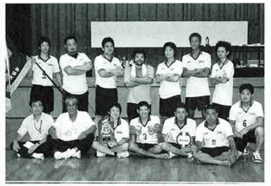
▲優勝した恩納体協男子のみなさん