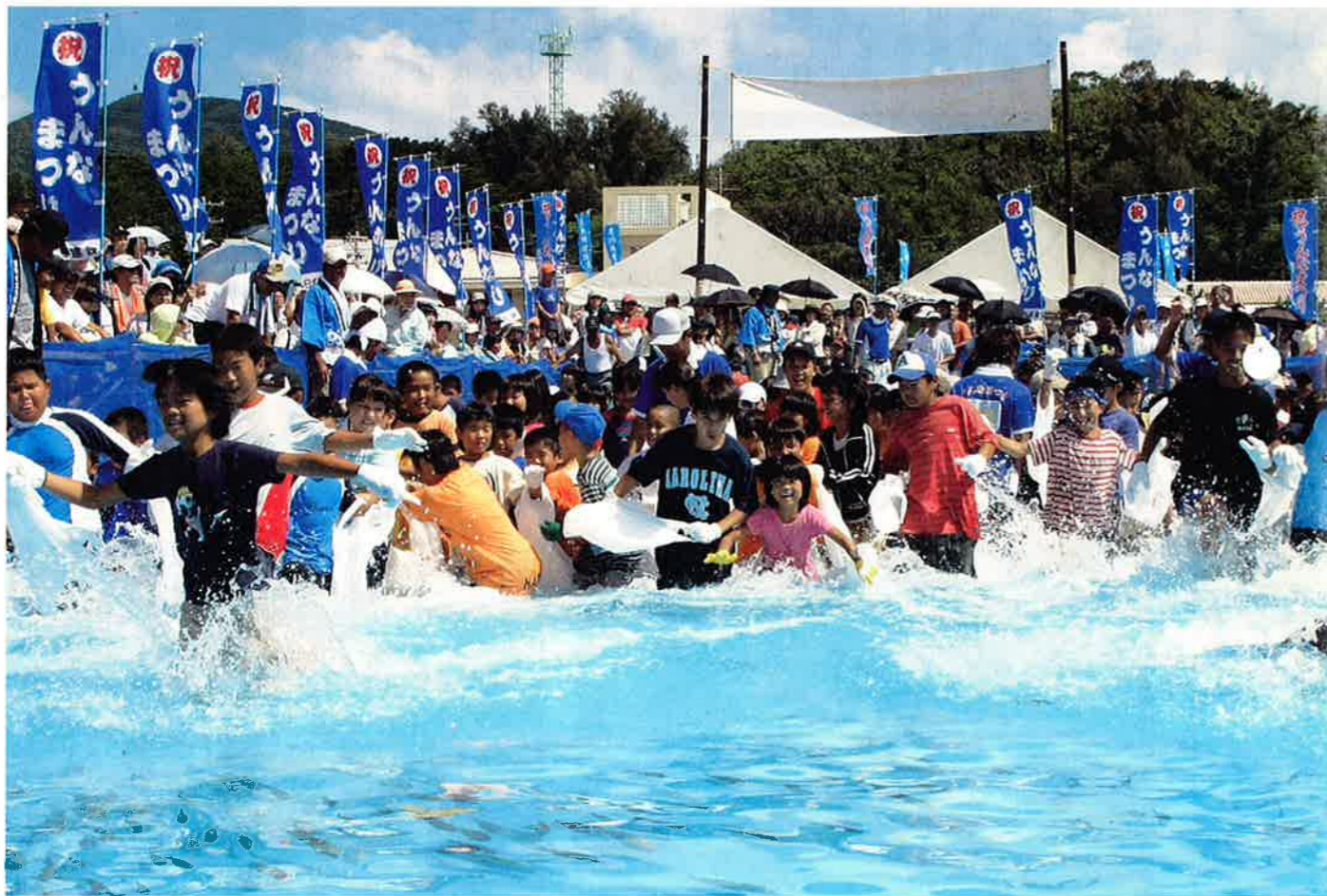
7月22日、23日にうんなまつりで行われた「魚のつかみ捕り大会」

男 5,238人 (+ 6) 女 5,070人 (+ 8) 計 10,308人 (+ 14) 世帯数 4,101世帯 (+ 14)