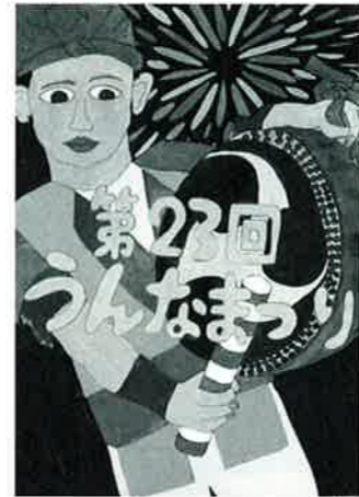
宮城 千南 (安富祖小6年)