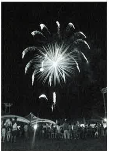
▲まつりの最後を飾った花火大会

「青い海 青い空 みんなあつまれ うんなまつり」をテーマに第23回うんなまつりが7月22日、23日の両日、村コミュニティ広場で盛大に開催されました。今年も多くのイベントが行われ、まつり会場特設ステージでは村民芸能や県内アーティストによるライブ、恩納・南恩納青年会のエイサーなどが行われ、来場者を楽しませました。一方、海浜公園では村内小学生ビーチドッチボール大会、コミュニティセンターホールでは幼稚園児童大会、小・中学生作品展などが開かれ、出場するわが子を応援しようとする父母らが会場に駆けつけ熱い声援を送っていました。