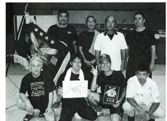
▲4連覇を果たした仲泊体協チーム