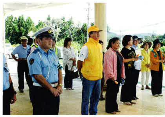
▲飲酒運転撲滅キャンペーンに参加したみなさん

飲酒運転撲滅を目的に7月19日、石川地区交通安全協会は、国道58号線恩納村役場前で「ミニほろつきで飲酒運転撲滅一掃作戦」と題して街頭キャンペーンを行いました。現在実施されている夏の交通安全県民運動「つい一杯 鈍る判断 待つ地獄」をスローガンに展開されている中、本村は沖繩県の中でワースト1の検挙率という不名誉な状況にあり、この状況を打開する為にこの事業を行いました。 今回恩納村交通安全母の会と役場職員総勢30人が参加して行った同事業は、信号待ちをしている車の運転手に「ミニほろつき（飲酒運転をほろつきで綺麗に一掃するという意味）」と飲酒運転撲滅要項を配り、撲滅の重要性を訴えました。 参加したみなさんは、「このキャンペーンで村民が飲酒運転について深く考え撲滅して欲しい」と語っていました。