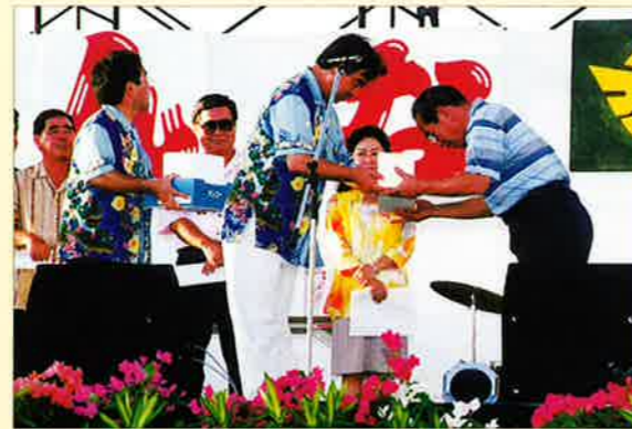
▲恩納村「島うた」公募入選者の表彰