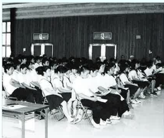
▲会場では多くの中学生が主張を聞きました