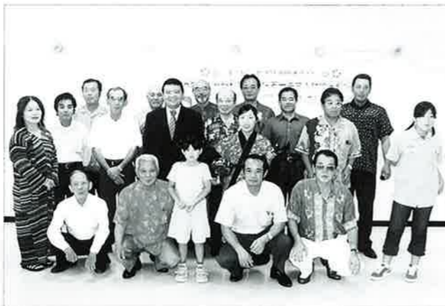
▲ 海外移住者子弟の来村を参加者皆で歓迎