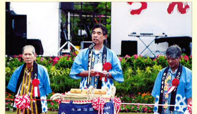
▲志喜屋村長による開会宣言