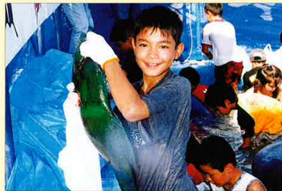
▲大きな魚を取ってニコリ