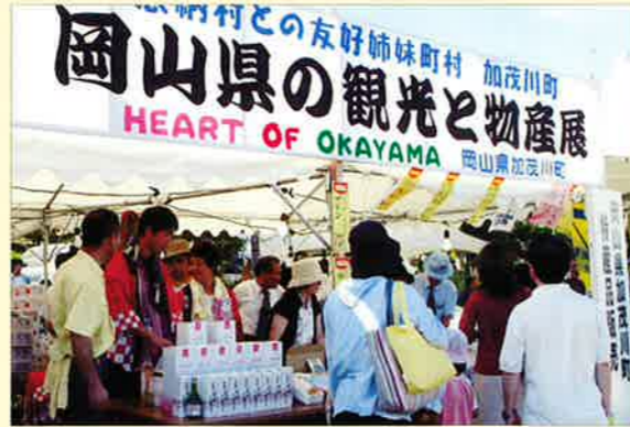
▲友好姉妹町村の加茂川町の特産品も販売