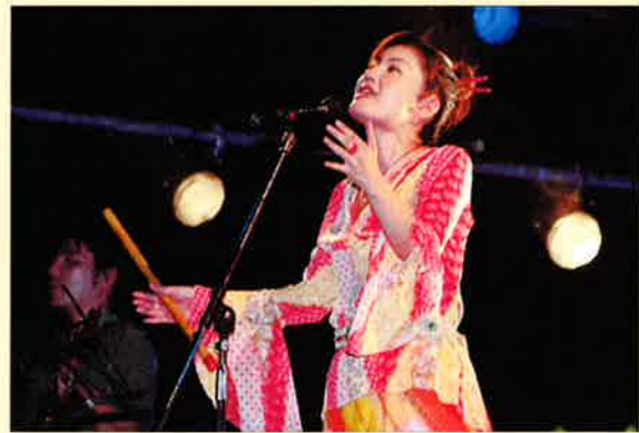
▲フィナーレは「しゃかり」ライブ