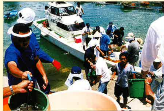
▲うんなまつりには多くの皆さんが協力