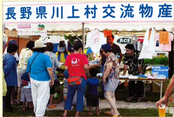
▲川上村も新鮮野菜を販売