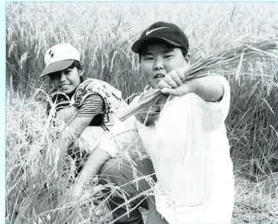
▲太陽の下元気ががんばりました