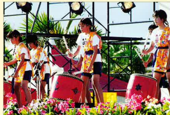
▲村民芸能で発表する子ども達