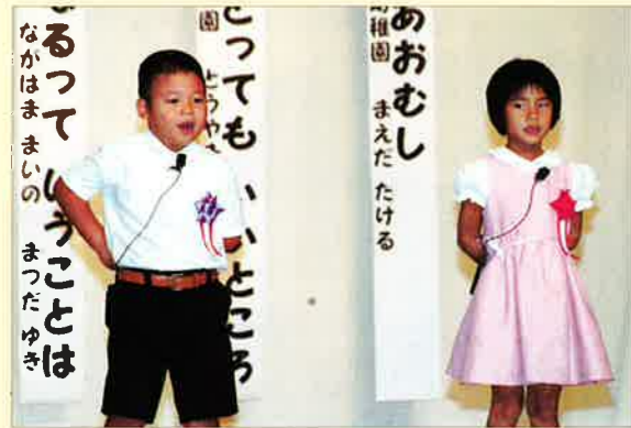
▲元気いっぱい幼稚園児童話大会