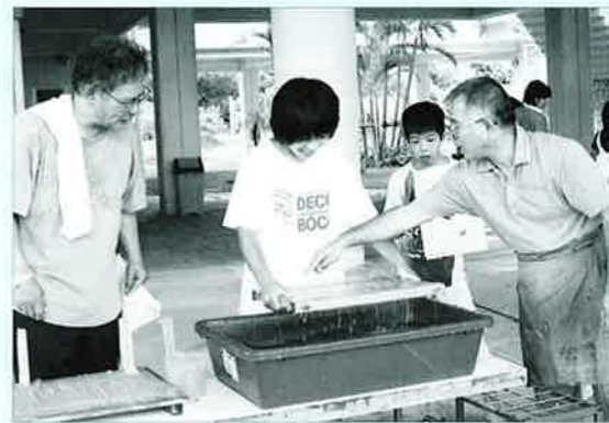
▲講師の上地先生から漉き方の指導