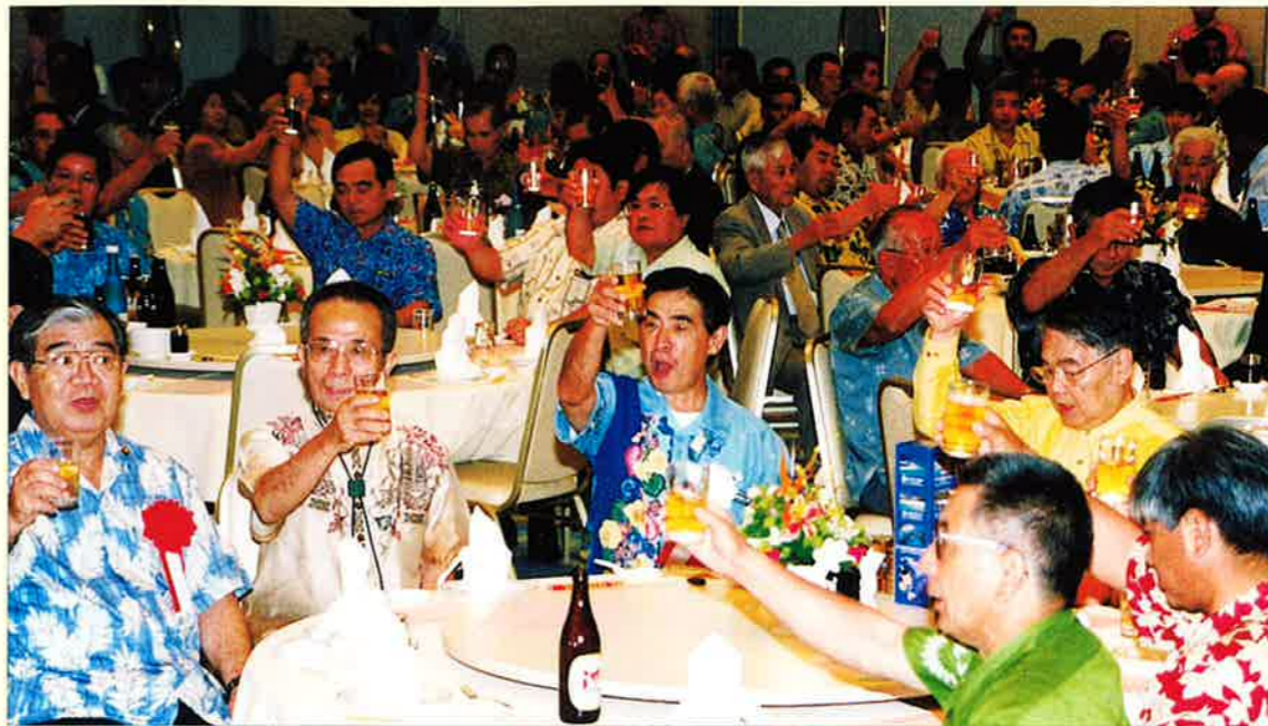
▲恩納への誘致決定を祝い乾杯