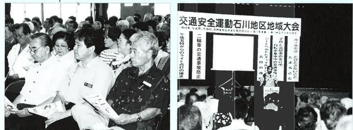
▲地域から交通事故をなくそうと多くの関係者が参加

交通安全運動石川地区地域大会 交通安全運動石川地区地域大会 交通安全運動石川地区地域大会 交通安全の遵守と正しい交通マナーの実践と交通事故防止の徹底を図ることを目的に、平成十五年春の全国交通安全運動石川地区地域大会が恩納村、石川市、金武町、宜野座村の一市一町二村の関係者が参加し五月十日、村コミュニティセンターで開催されました。