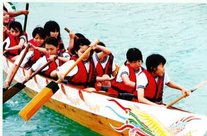
▲仲泊校の生徒がハーリーに挑戦