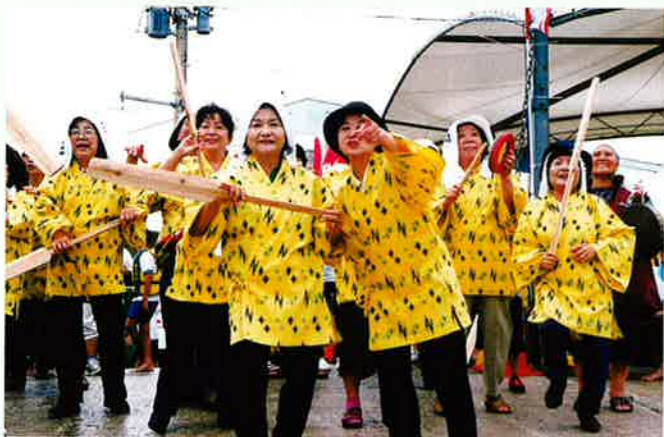
▲地元婦人会から声援が送られました