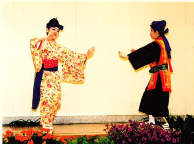
▲華やかな舞踊も会場披露