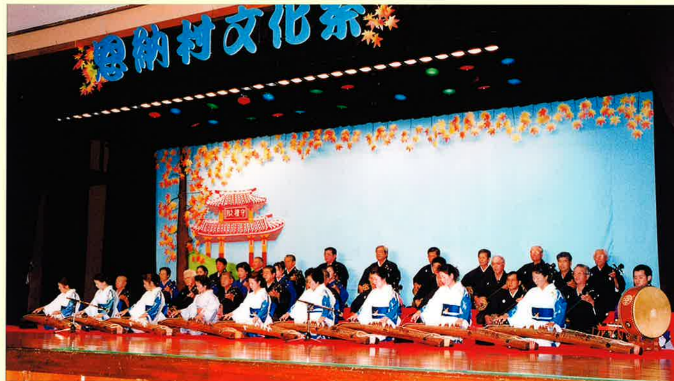
▲琉球古典音楽部会による幕開け演奏