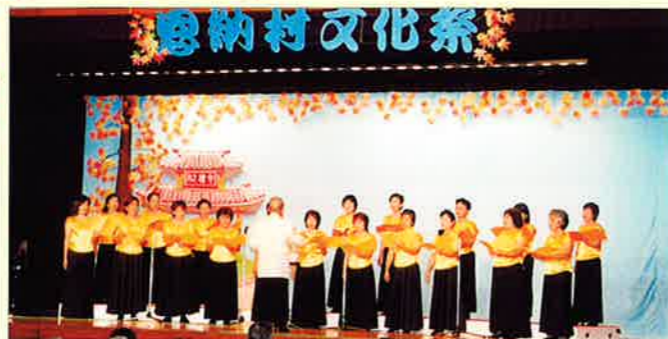
▲合唱 (ナビーズコーラス)