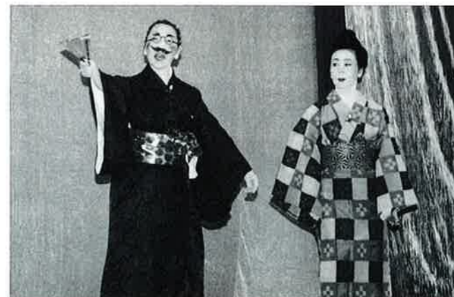
▲40年ぶりの上演となったカンカンパチパチ