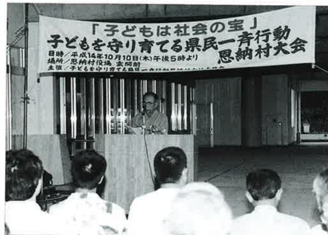
▲子どもの育成に積極的にかかわりましょうと大城村長