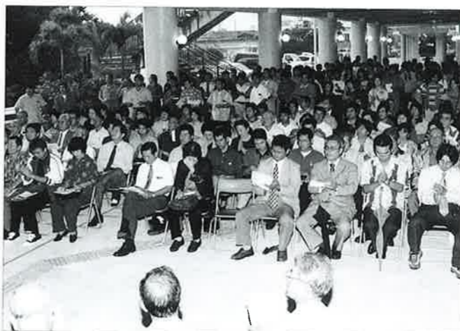
▲青少年育成に携わる多くの村民が参加

本県で心身ともに未熟な中高校生を被害者とする買春事件が相次ぎ、事件の重大さをとらえ県内各地域で一斉に県民行動が行われました。 村でも、青少年育成に携わるPTA・子ども会等をはじめとする青少年育成団体や保護者・地域住民が参加して十月十日、村役場正面玄関前で大会が開催されました。 大会では、主催者を代表して村青少年健全育成協議会会長の大城村長は、「子ども達の育成に積極的にかかわり