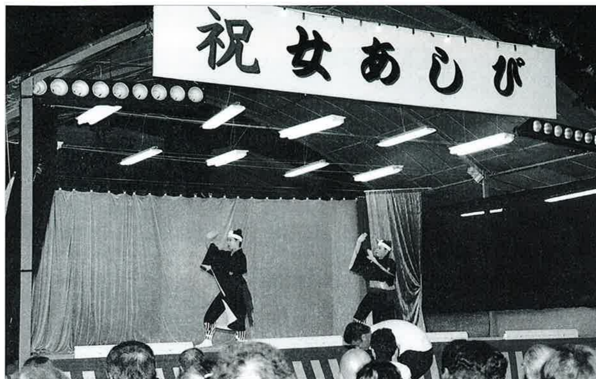
▲会場となったあしびなーに準備された舞台上で披露