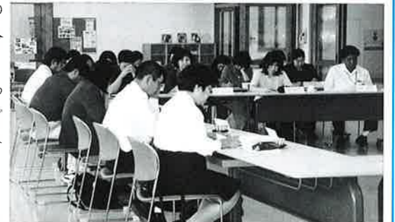
9月30日に開催された第1回地域ケア会議

お問い合わせ先:恩納村在宅介護支援センター(恩納村総合保健福祉センター内) 電話098-982-3500