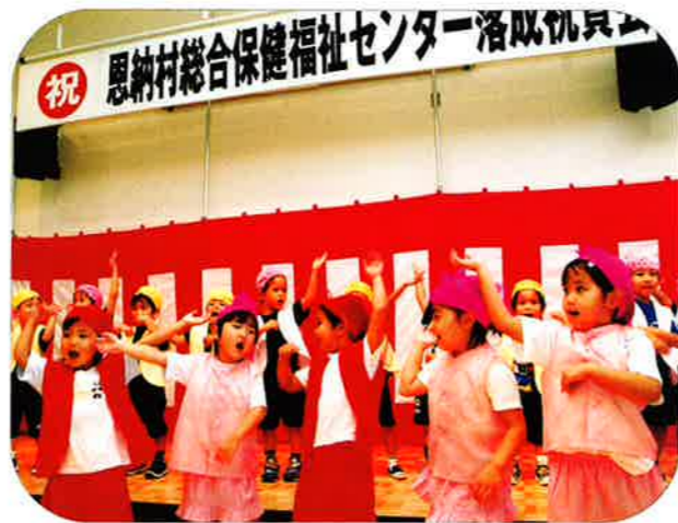
恩納村保育園の園児による余興