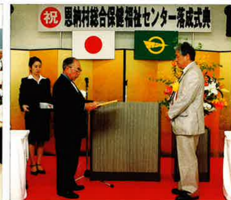
落成を記念に感謝状の贈呈

また、式典終了後に開催された祝賀会では、村文化協会による幕開けの古典音楽演奏や恩納村保育所、南恩納婦人会、仲泊老人会の余興も披露され、総合保健福祉センターの落成を共に喜んでいました。