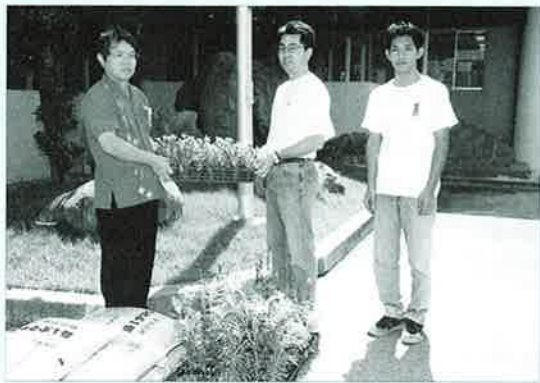
▲仲間局長から花の苗の贈呈