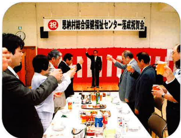
保健福祉センターの有効活用を願って乾杯