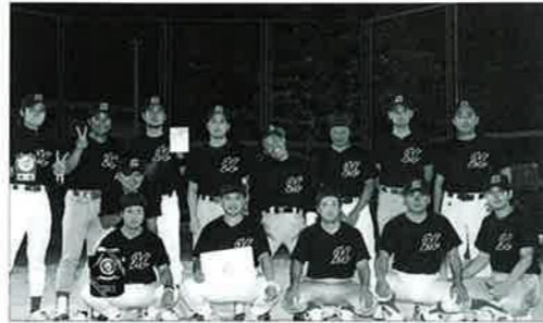
▲準優勝の前兼久体協