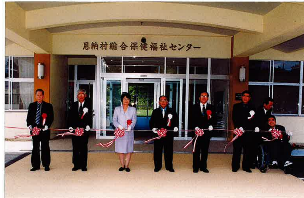
大城村長と関係者によるテープカット

保健事業の拠点として南恩納区内に建設工事が進められこの程工事が完了した恩納村総合保健福祉センターの落成式典並びに祝賀会が四月三十日、同センター内で多くの関係者が出席して盛大に開催されました。