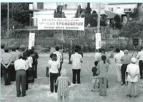
▲多くの区民が指定書交付式に参加