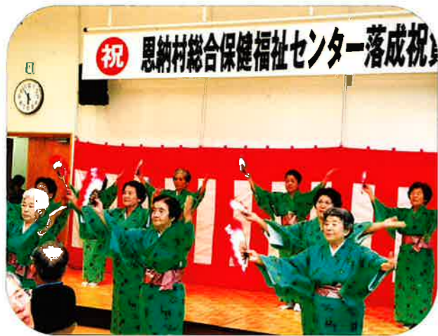
仲泊老人会による余興