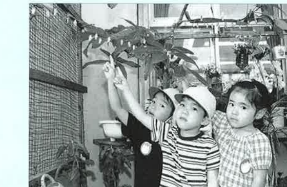
▲もう間もなく蝶になります。

られ、それ以外の蝶が来ることも園児は心待ちにしています。 また園児らは、周辺の食草で見つけてきた蝶の幼虫も怖がる様子もなく飼育小屋に運び幼虫がサナギを経て蝶になる日を楽しみに皆で協力して飼育しています。 羽化が終了する頃には、園児が協力して大切に育ててきた飼育小屋から自然に放すと長嶺先生は話していました。