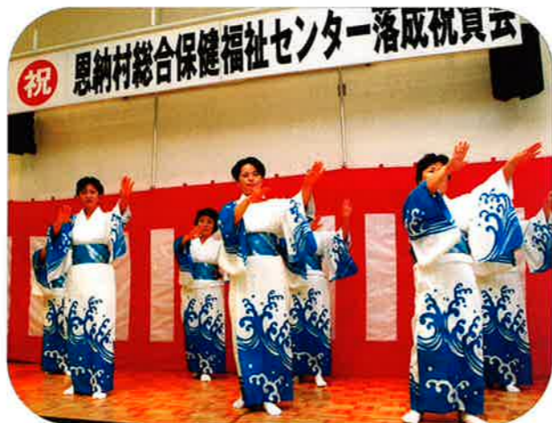
南恩納村婦人会による余興