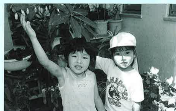
▲園児が協力して飼育するオオゴマダラのサナギ