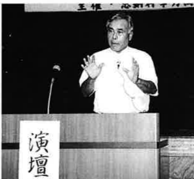
▲教育の主役は子供達

9月27日、コミュニティセンターにおいて「自ら学ぶ子を育てるには」と題して同氏による講演会（村学向上対策委員会主催）が行われ百五十名余りが参加した。