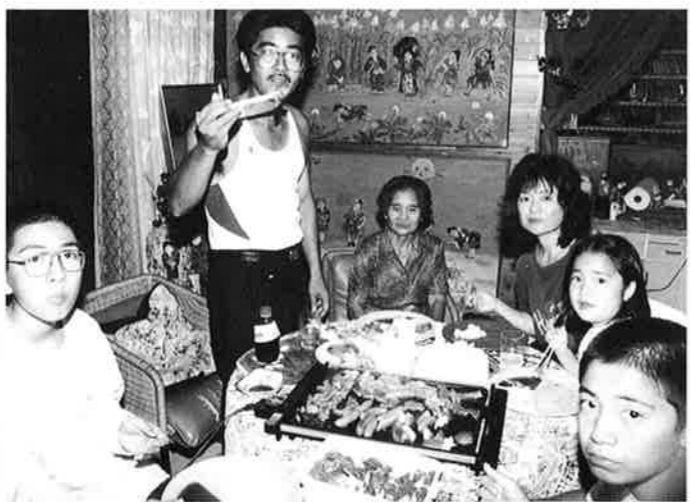
▲民泊では沖縄の味を満喫