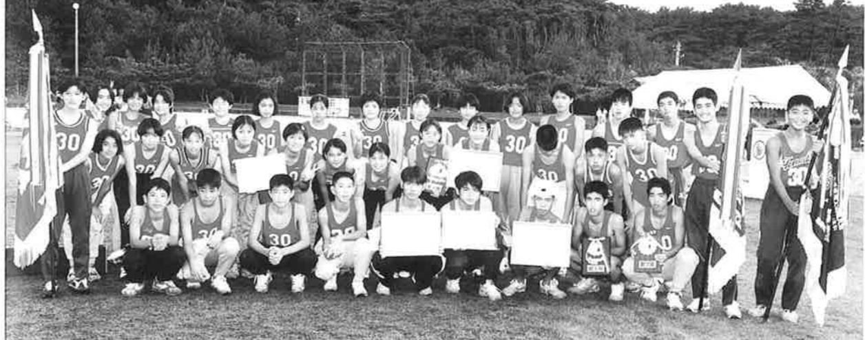
▲総合優勝の山田中学校

10月1日、第二十一回陸上競技大会(村体育協会主催)と第17回中学校陸上競技大会(青少年健全育成協議会主催)が村立赤間運動場において行われました。