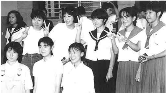
▲今日からはお友達

よる少女暴行事件に関心を示すなど、平和の尊さについて考える旅になったようです。来年は恩納村の中学生が石狩町を訪問する予定で南北の子供達の友情がいつそう広がることでしょう。