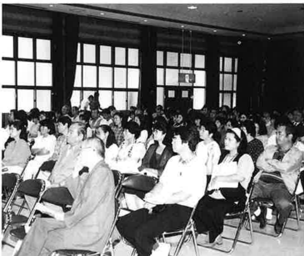
▲講演に聞き入る参加者

子供達が受動的な立場にある教え込む教育、「知識が学力のすべて」の学力観から脱却し、子供達に「何のために・何を・どう学ぶか」を理解させ自主的に学べる環境を作ることが教師や親の役目。「これからの教育は子供達が主役である」と講演を終えました。