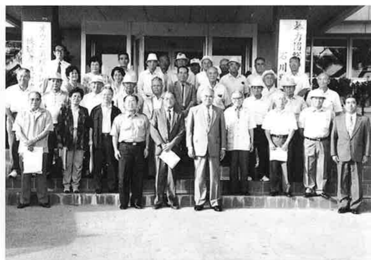
▲高齢者地域安全教室の参加者の皆さん

最後にはパトカーへの体験乗車も行われ「パトカーに乗るのはこれで最後にしたい」と笑いながら参加者は話していました。