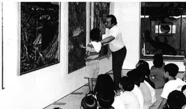
▲先生から説明をうける子供達

芸術祭は村民が心待ちにするイベントのひとつになっていきます。優れた芸術作品を身近に触れることは子供達の心豊かな人間形成の発展に大きく寄与するものです。会場には教育委員会が準備したマイクロバスを利用して各学校から子供達が訪れ優れた芸術作品を熱心に鑑賞していました。