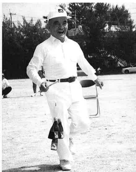
▲酒釣り競争は一人一本ずつ

婦人会の年齢別リレーや老人会による万座つり競争や風船割りなど、応援団から大きな声援を受け、元気はつらつ競技を行いました。午後からは老人クラブ、婦人会一緒の恩納村音頭、参加者は時間の経つのも忘れ楽しい一日を過ごしました。