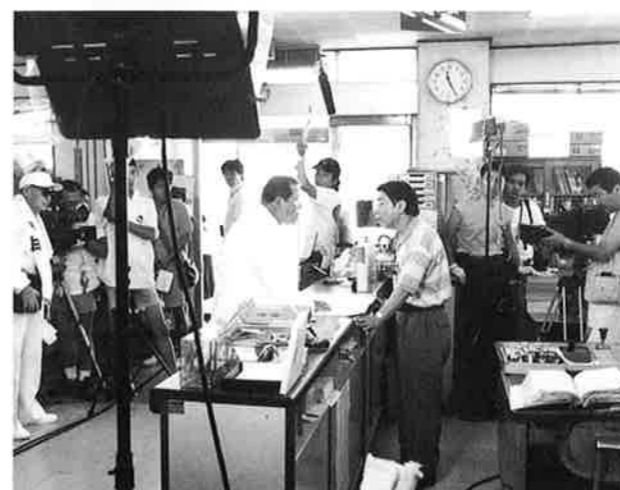
▲撮影は約30人余りのスタッフで行われた