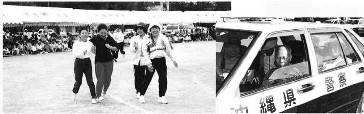
▲息のあった二人三脚もゴールでは転倒