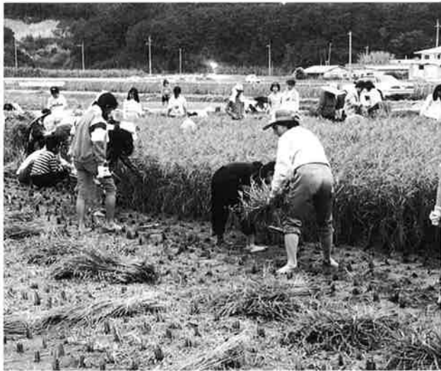
▲ほとんどの参加者が稲刈り初体験

子供達は「自分たちで収穫した米で餅つきに挑戦したい」と収穫の喜びを言葉にしています。