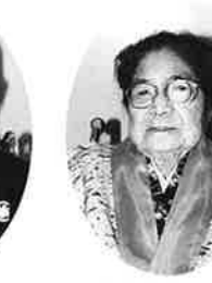
名嘉眞カマド (谷茶の丘)