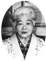
宇栄城八重 (喜瀬武原)