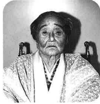
佐渡山ウト (谷茶の丘)