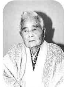
仲宗根カマド (谷茶の丘)