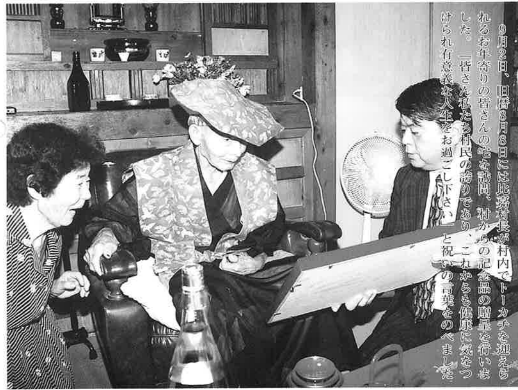
9月2日、旧暦8月8日には比嘉村長寿村内でトーカチを迎えらるお年寄りの皆さんの宅を訪問、村からの記念品の贈呈を行いました。「皆さんは私たちの村の誇りであり、これからも健康に気をつけてくれ有意義な人生をお過ごし下さい」と祝いの言葉をのべました。