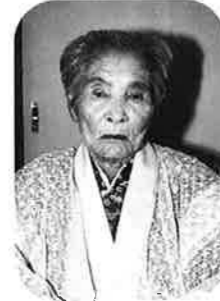
古謝ムヌル (谷茶の丘)