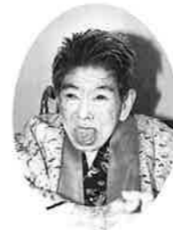
比嘉カマド (谷茶の丘)