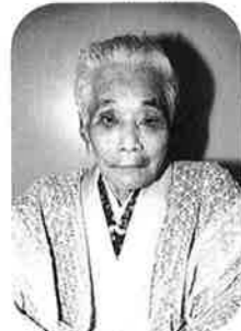
長濱かめ (谷茶の丘)