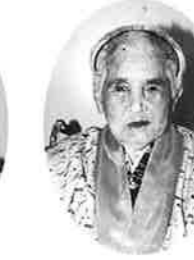
亀浜カメ (谷茶の丘)