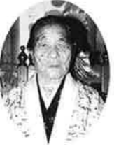
當山カマド (安富祖)