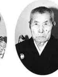
津波古武吉 (谷茶の丘)