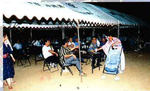
勢い余って来賓席へ