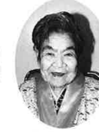
親泊マカト (谷茶の丘)