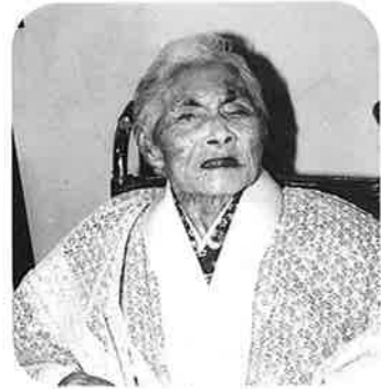
金城マツ (谷茶の丘)