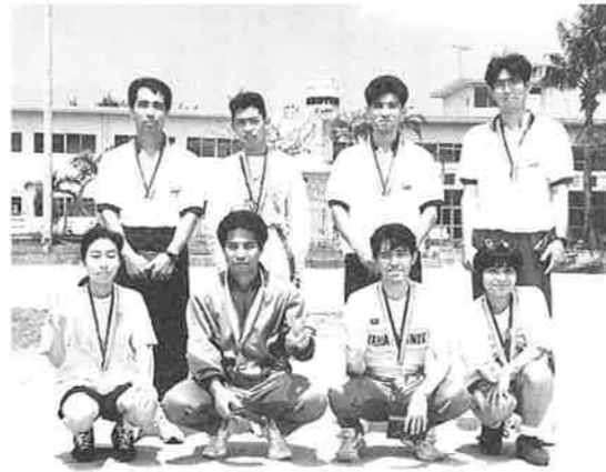
頑張った、区間賞の皆さん