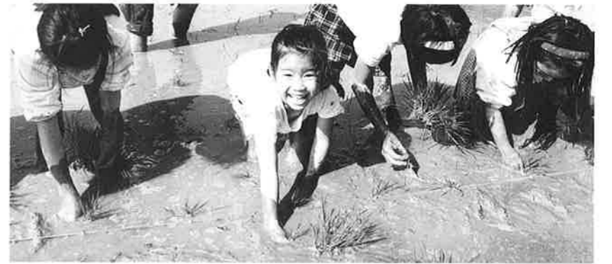
子ども会の田植え体験学習

戦後五十年、いまだに残る傷跡 瀬良垣区の海岸に未使用の砲弾 「住民から不発弾がある」との情報が入り、役場の係が現場を確認したところ、瀬良垣区のペンションバイザシー裏の海岸で干潮時には水面上に現れるほど住民地域に近い場所がありました。海上保安庁と自衛隊不発弾海中処理隊が四月十四日に現場を調査したところ、発見されたのはアメリカ製の野戦用一〇四mm砲弾で、薬きょう部分が付いていることから使用前の砲弾と判明しました。製造年、一九四四年(昭和19年)の