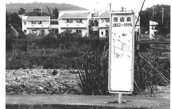
喜瀬武原線が休止、再び運行する日は

琉球バスの喜瀬武原線は、日常生活の中で親しまれ、地域住民、特に高校生の通学手段として利用されてきました。ところが、会社側は喜瀬武原線について、バス路線の維持運営が極めて困難な状況として、平成六年十二月十九日付けで許可を受け、喜瀬武原線の休止を通知してきました。 同区が米軍のキャンプハンセン演習場に囲まれ基地被害の重圧を受けている特殊事情の中で、交通の利便性の悪化を拡大することは今後の地域振興に悪い影響をあたえることが考えられます。