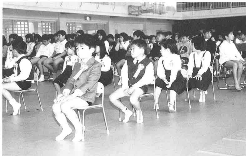
山田小学校入学式より

村内五つの小学校へ入学する児童は、103人（安富祖小16人、喜瀬武原小9人、恩納小45人、仲泊小17人、山田小16人）。四月七日の入学から、「いちねんせい」としての学校生活がスタートします。 真新しいランドセルを背負った子ども達は不安と期待で小さな胸がいっぱい。一日も早く新しい学校生活に慣れるように、地域を上げて、温かく見守ってあげましょう。