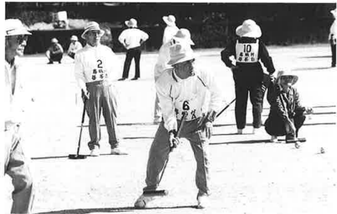
運動は健康づくりの基本

この国民健康保険の医療費が年々増加の傾向にあり、国保財政を圧迫し大きな社会問題になっています。ちなみに、恩納村一人当たりの医療費は老人医療対象者で約49万円、一般分で約19万円です。