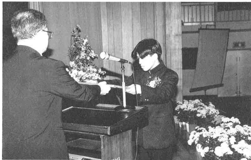
安富祖中学校卒業式より

三月二十二日、村内五つの中学校では卒業式が行われました。133人の生徒が高等学校へ、社会へと三年間の思い出を胸に旅立ちました。 また、村内五つの小学校でも三月二十二日、二十三日に卒業式が行われ139人の児童が、小学校を巣立っていきました。 ご卒業おめでとうございます。卒業式の感動を忘れる事なく、新しい目標に向かって頑張ってください。