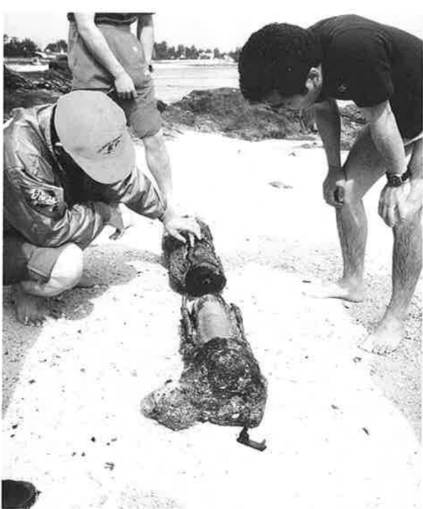
砲弾を調査する自衛隊不発弾処理隊

文字もはっきり確認でき、戦後五十年の歳月を感じさせないほどでした。発見者の話では、この近辺の海にはまだ多くの砲弾があるということです。自衛隊不発弾処理隊の話では、腐食が激しく爆発の危険性がないものであっても、起爆装置である信管の爆発でも十分殺傷能力があるので、発見した場合は速やかに連絡するようにと話していました。