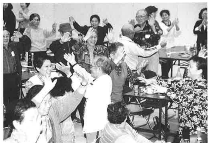
懇親会の最後はカチャーシーで

二十六日には村主催の歓迎会が行われた他、二十七日には老人会との交流グラウンドゴルフ大会も行われました。その後行われた老人会との懇親会では村婦人会、生活改善グループ、農協婦人部による手料理に舌鼓をうちました。