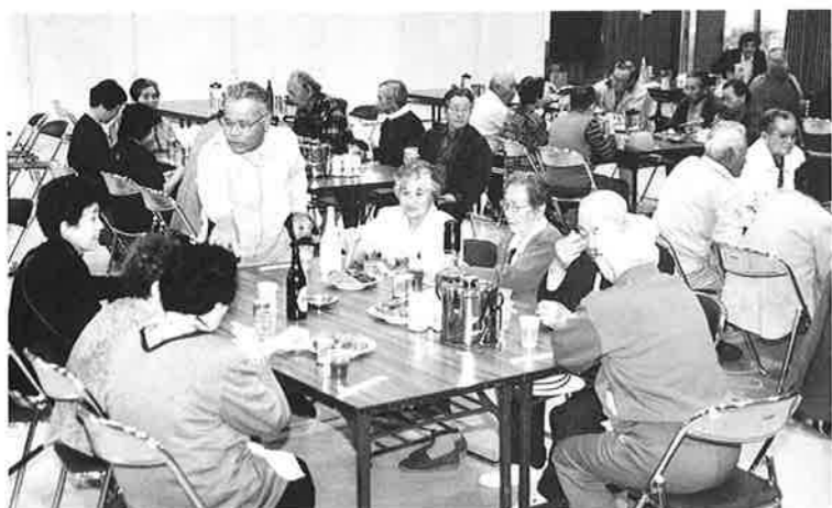
海ぶどうが一番人気

一月十七日、阪神地方を襲った大震災は五千名余の貴重な命を一時にして奪い、被災者の中には今なお、避難所生活を余儀なくされている方々も少なくありません。 暖かい沖縄で少しでもくつろいでもらおうと、被災地の七十歳以上のお年寄りを対象に沖縄県が募集した沖縄リフレッシュツアーの一行が三月二十五日から五泊六日の日程で本村を訪れました。