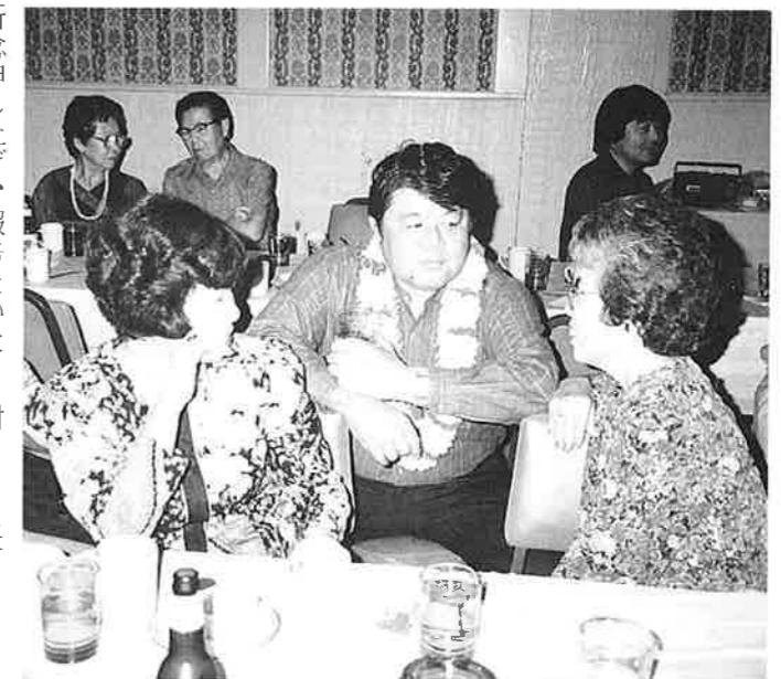
ハワイでの歓迎会