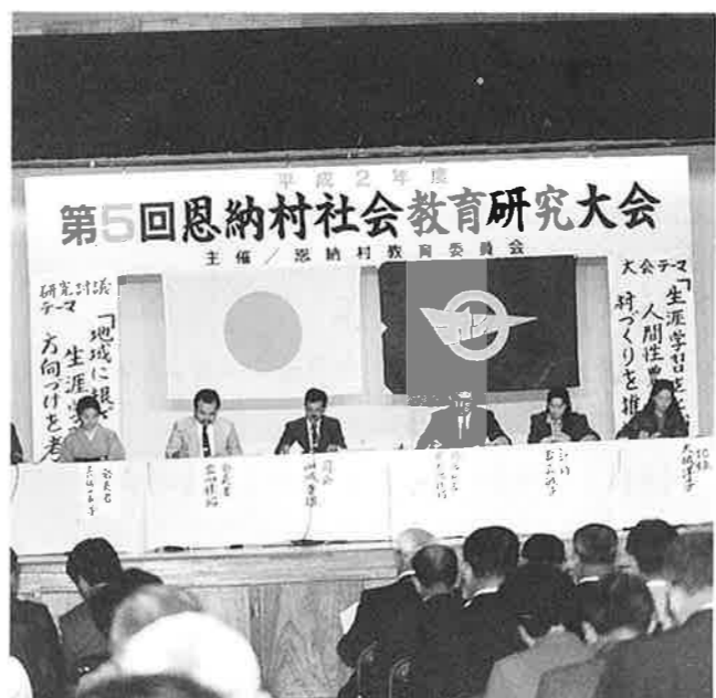
実践発表及び研究討議

平成2年度 主催/恩納村教育委員会 「地域に根ざした生涯学習の方向性」 「生涯学習をとおしての人間性豊かな村づくりを推進する」