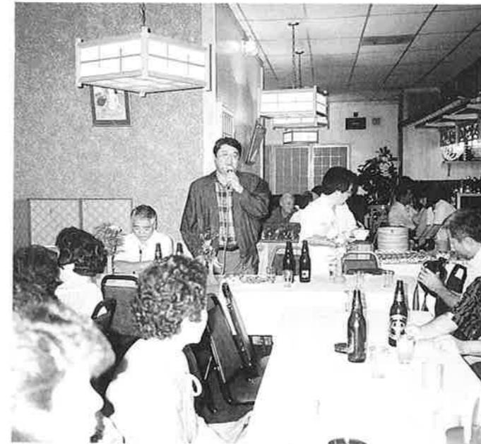
ロサンゼルスでの歓迎夕食会

日本は、緑豊かな自然をもつ国です。特に四月から五月にかけては、新緑が美しい季節——春の陽光や暖かさも手伝い、生命の息吹を感じます。 ところでみなさんは、「みどりの日」「みどりの週間」をご存じですか。「みどりの日」は、平成元年に「国民の祝日に関する法律」の一部を改正する法律に みどりの日 (4月29日) みどりの週間 (4月23～29日) より制定され、四月二十九日と決められた国民の祝日です。自然に親しみ、その恩恵に感謝し、豊かな心をはぐくもうという日です。「みどりの週間」は、この考えを一層深めるために設けられたもので、四月二十三から二十九日の一週間と定められています。気候のよいこの時期、あなたも、森林浴を楽しんで