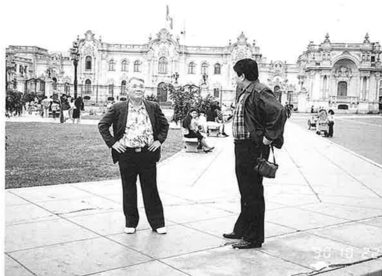
大統領府前のアルマス広場

平成二年十月十日から二九日までの二〇日間南米四ヶ国（ブラジル、アルゼンチン、ボリビア、ペルー）及びハワイの移住者の激励並びに二世、三世等子弟と本村との今後の交流の在り方等を調査する目的で訪問し懇親を深めましたので、ご報告申し上げます。