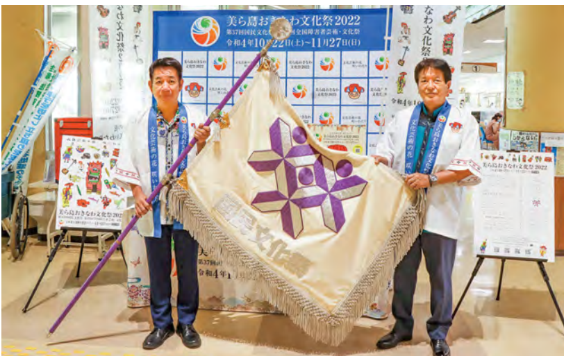
▲大会旗展示（役場1階ロビー）

恩納村では美ら島おきなわ文化祭の独自事業として、復帰50年記念特別展「復帰から半世紀を迎えたうんな展」を開催します。