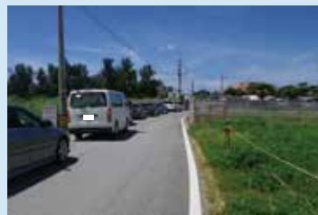
ダイビング客が多いエリア