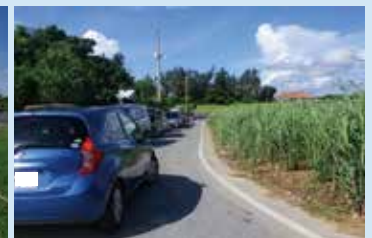
ダイビング客が少ないエリア