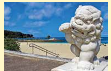
海浜公園ナビビーチ