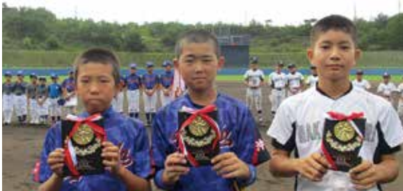
左から 打撃賞 殊勲賞 敢闘賞