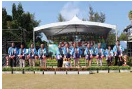
▲オープニングセレモニー