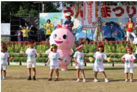
▲solunaによる「さんごDEマンボ」の歌にあわせて、村立保育所の園児らのダンス

当初予定していた21日、22日から台風接近のため順延となり、プログラムの一部に変更があったものの関係者の協力のもと、2日間で19,000人余りの来場がありました。