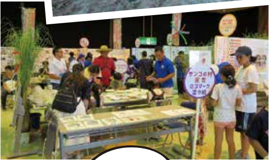
◀サンゴの村フェスタ