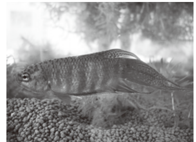
タイワンキンギョ