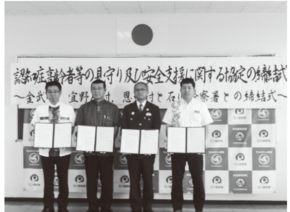
▲左から長浜村長、仲間金武町長、石川警察署長、當間宜野座村長