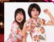
司会/スズカーサーキット

※会場内は、一般駐車スペースがありませんので、赤間総合運動公園・前兼久漁港の臨時駐車場をご利用になるか、バス・タクシーをご利用ください。