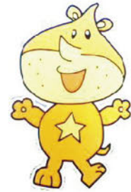
リサイクルリンちゃん