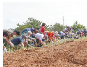
ベチパー植え付け