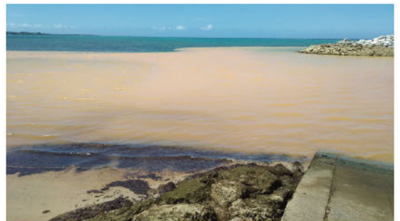
海に赤土が流れ込んだ様子

サンゴにとって、赤土の流出は深刻な問題です。海が濁ると、サンゴと共生する褐虫藻が光合成できなくなったり、サンゴの上に土が積もると、サンゴが息をできなくなってしまう。赤土はとても粒子が小さいので、すぐに沈殿せず、いつまでも海の中を漂い続けます。美しい海を守るためには、まず陸域の環境を整えることが不可欠なのです。