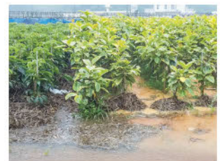
葉ガラマルチングの効果