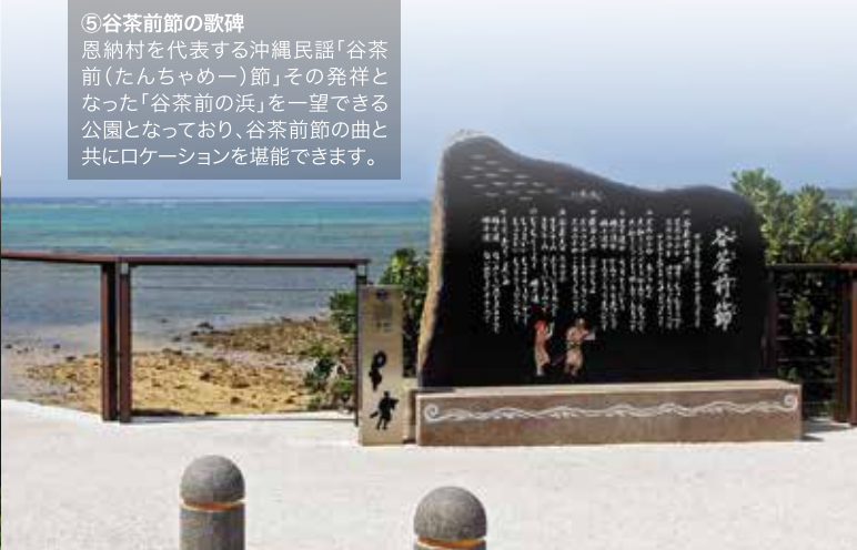
⑤ 谷茶前節の歌碑 恩納村を代表する沖縄民謡「谷茶前(たんちやめー)節」その発祥となった「谷茶前の浜」を一望できる公園となっており、谷茶前節の曲と共にロケーションを堪能できます。