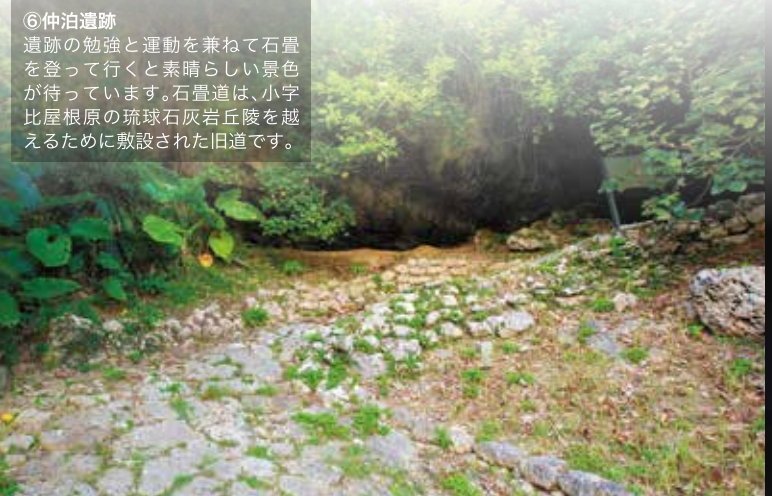
⑥ 仲泊遺跡 遺跡の勉強と運動を兼ねて石畳を登って行くとき素晴らしい景色が待っています。石畳遺跡は、小学比屋根原の琉球石灰岩丘陵を越えるために敷設された旧道です。