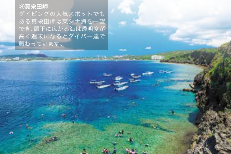
⑧ 真栄田岬 ダイビングの人気スポットでもある真栄田岬は東シナ海を一望でき、眼下に広がる海は透明度が高く週末になるとダイバー達で賑わっています。