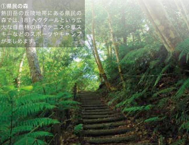
① 県民の森 熱田岳の丘陵地帯にある県民の森では、181ヘクタールという広大な自然林の中でテニスや草スキーなどのスポーツキャンプが楽しめます。

沖縄本島の中心を縦に伸びる恩納村の海岸線は、県内屈指のドライブルート。コバルトブルーの空と海、そして茜色に輝くサンセットがこの村のハイライトです。そして、かつての旅人達の足跡や人情味あふれる村民たちが、恩納村の魅力に素敵なスパイスを加えています。