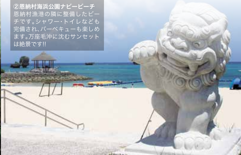
② 恩納村海浜公園ナベビーチ 恩納村漁港の隣に整備したビーチです。シャワー・トイレなども完備され、バーベキューも楽しめます。万座毛沖に沈むサンセットは絶景です!!