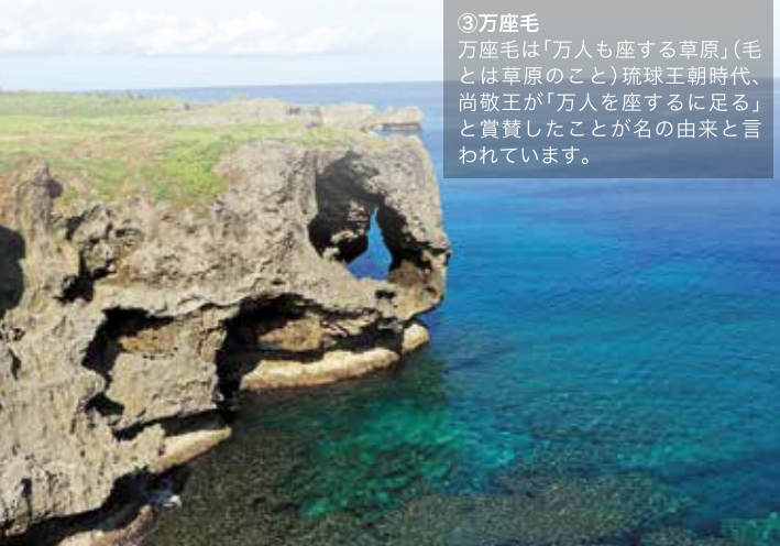
③ 万座毛 万座毛は「万人も座する草原」(毛とは草原のこと)琉球王朝時代、尚敬王が「万人を座するに足る」と賞賛したことが名の由来と言われています。