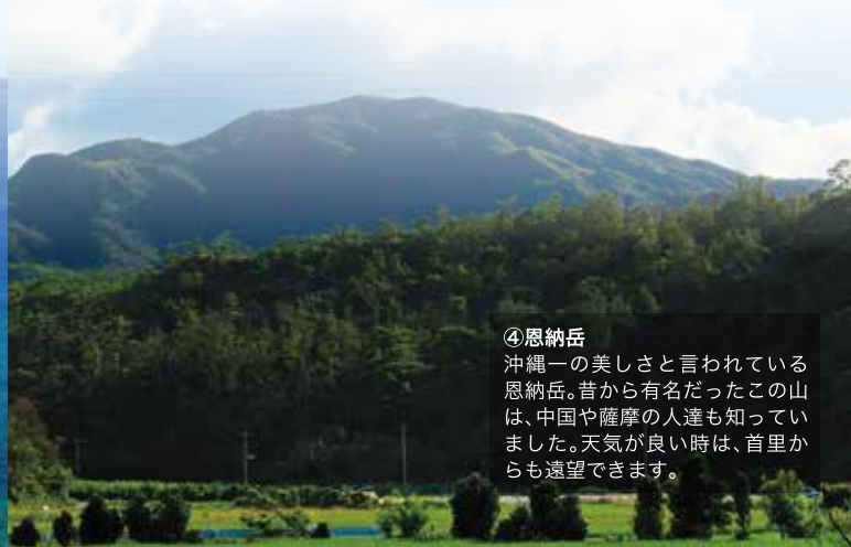
④ 恩納岳 沖縄一の美しさと言われている恩納岳。昔から有名だったこの山は、中国や薩摩の人達も知っていました。天気の良い時は、首里からも遠望できます。