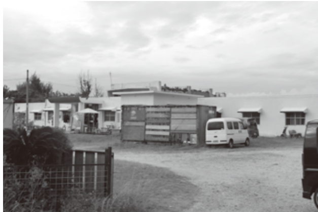
旧ユースホテル跡地の現状

私も、山田区の合意形成が一番大切なことと考えております。これからは、しっかりと区のほうで議論して頂きたいと思っております。