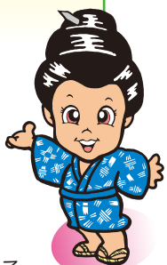
情熱の歌人 うんなナビー

今年も、公民館で農業漁業生産者育成奨励会が開催されました。以前、サトウキビ生産が盛んな頃は、生産者も多く製糖期が終了すると、農作業を労う為に、サーターマンサン(慰労会)を行っていました。近年では、キビ生産者の減少と機械化による従事者の減少に伴い、平成13年度より他の農業従事者を含めた奨励会へ、平成19年度より漁業従事者も含めた奨励会となりました。(大城区長) 奨励会では、永年農業、漁業に従事された方、又これからの担い手となる方を地区の農業委員、漁協理事、評議委員会の推薦により表彰を行っています。