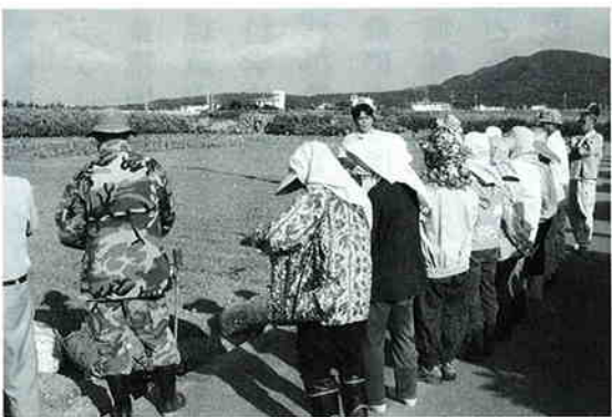
らっきょう植え付け講習会

南恩納野菜部会を中心に個人の三、四名は利用している。野菜の一定量がなかなか供給できない状況もある。