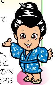
情熱の歌人 うんなナビ

今年は、年長児による沖縄数え歌の手あそび・リズムや玉入れ・集団あそびなど楽しいあそびを展開。今回はかがやきさん総勢12名が参加し、小さい子を抱っこしてもらったり、出来立てアツアツのたこ焼きをおいしくいただきました。子どもたちはたこ焼きの材料には「卵・たこ焼きの粉・おいしい水」が入っていることに興味を示し、「おかわり～」を連発大好評でした。今回の食事は安富祖保育所のベスト3に入っているメニューでタコライスを皆さんでいただきましたよ。11月23日は勤労感謝の日。お父さん・お母さんはもちろんのこと、身近な人々の仕事にも感謝の気持ちをもてるように「ありがとう」のたくさん飛び交う環境・社会が一番! まずは自分へありがとう! 感謝の心をもって人との繋がりを大切にしていきたいです。