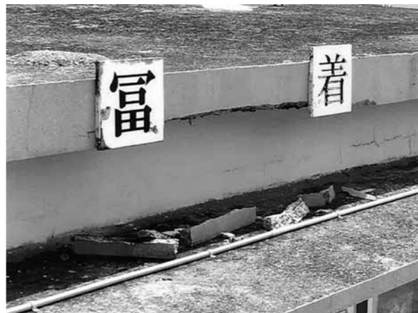
富着公民館の一部コンクリート坤崩落状況

を充当できるのか、これから検討してゆく。ですから、地域の方々が建設に向けて前向きに動く、地域の方々の協力、負担も含めて我々としては頑張りたい。