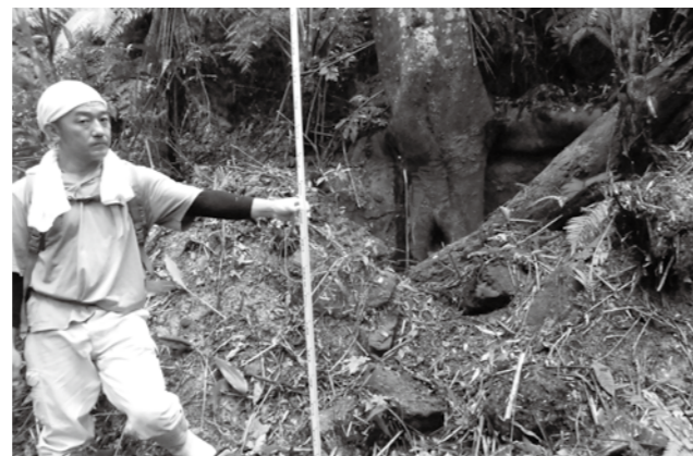
炭焼窯③ 使用しなくなって大きな木が生えています。