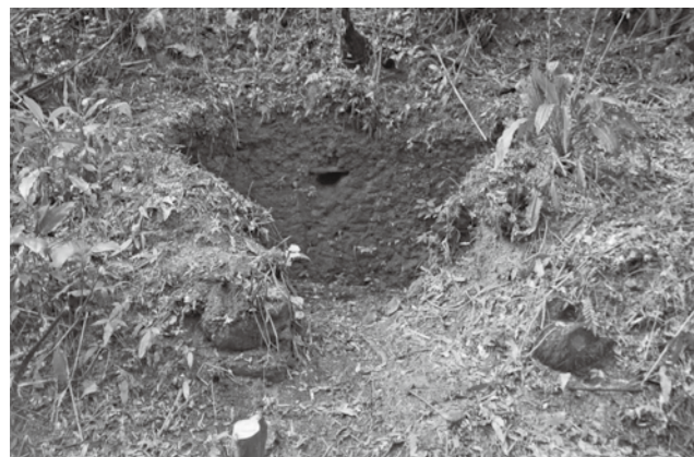
炭焼窯① 窯内に3つ煙道?があります。