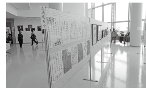
昨年の展示会場の様子