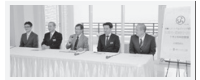
1市2村共同宣言記者発表会