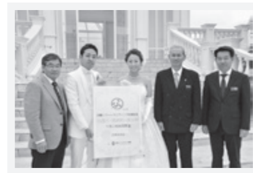
稲嶺市長(左)、石嶺村長(右から2番目)、長浜村長(右)