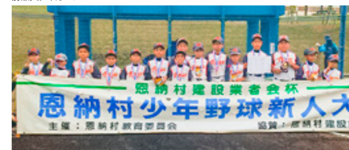
ティダ・キッズ・ファイターズ