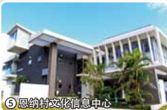
5 恩纳村文化信息中心

冲绳岛产蔬菜、南国水果以及土产品应有尽有直销店。可以品尝地道冲绳口味的10家B级美食滩头也很有名气。“恩纳站”位于从南驶入恩纳村落日海道的入口处。是可以稍微休息一下的。务服送配提供。场所) 息体 (UKUYAKAN “停车场 133个车位 (免费) 全年无休。