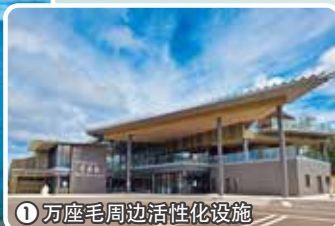
1 万座毛周边活性化设施

高20米的琉球石灰岩断崖以及上方广阔的草坪公园。据说琉球王尚敬曾赞其为“足可坐万人之毛(原野)”,并据此为其命名。晴朗的日子,一直延伸到遥远水平线的蔚蓝大海熠熠生辉。傍晚,夕阳西下之景如梦似幻,不可错过。