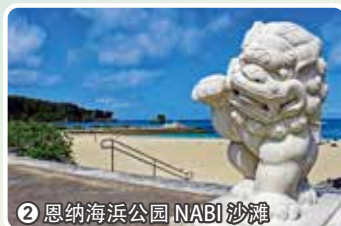
2 恩纳海滨公园 NABI 沙滩

具备了礼品店、饮食店、展示区以及观景台的设施。3层高的建筑,1楼是地方特产专区,2楼是饮食店和小卖部,3楼设有能眺望海景的观景长廊。