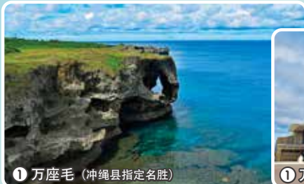
1 万座毛 (冲绳县指定名胜)

高20米的琉球石灰岩断崖以及上方广阔的草坪公园。据说琉球王尚敬曾赞其为“足可坐万人之毛(原野)”,并据此为其命名。晴朗的日子,一直延伸到遥远水平线的蔚蓝大海熠熠生辉。傍晚,夕阳西下之景如梦似幻,不可错过。