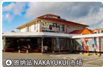
4 恩纳站 NAKAYUKUI 市场

可以远眺东海,眼前是一望无际的海洋,海水透明度高,是众多潜水者蜂拥而至的胜地。还可在此享受岩礁垂钓的乐趣。沿着通往大海的阶梯,可以前往人气潜水胜地。