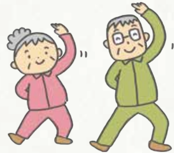
配食サービス事業による安否確認と食の自立を支援する。