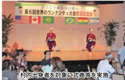
村内出身者を対象に式典等を実施