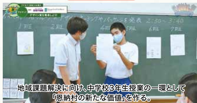
地域課題解決に向け、中学校3年生授業の一環として『恩納村の新たな価値』を作る。