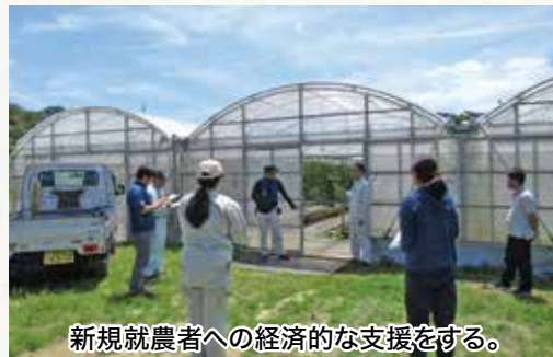
新規就農者への経済的な支援をする。