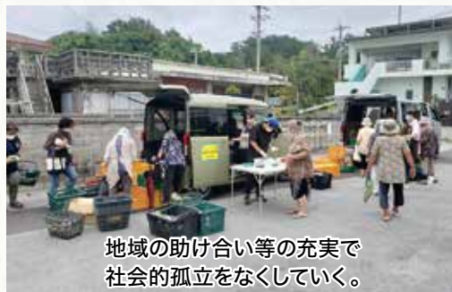
地域の助け合い等の充実で社会的孤立をなくしていく。