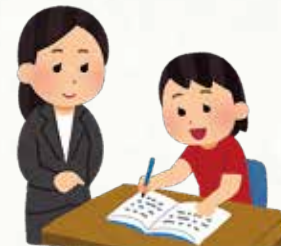
コミュニケーション能力の育成で、学習や生活の困難克服のための指導