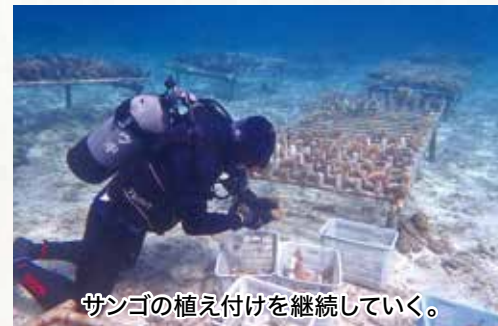
サンゴの植え付けを継続していく。