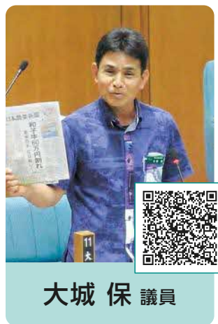
大城 保 議員