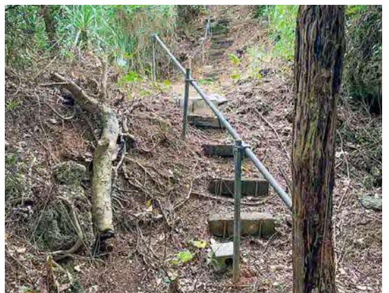
▲整備された「コージガマ」の入り口

提 区としては大掛かりな整備は望んでいません。しっかりとした手すりや階段は必要不可欠であり、何らかの補助ができないのか、前向きな検討をお願いします。