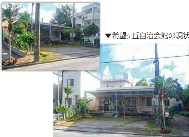
▼希望ヶ丘自治会館の現状

④崖の危険調査↓崖の木を伐採することによって歩行者が安全に通行できると考えています。⑤道路の補修・⑥道路に徐行を促す表示に関して↓今後下水道整備が行われますので、それを確認しながら検討したいと考えています。⑦希望ヶ丘内の除草作業を有償にて請け負いたい↓現在、業者へ委託していますので、できない旨をお伝えしています。