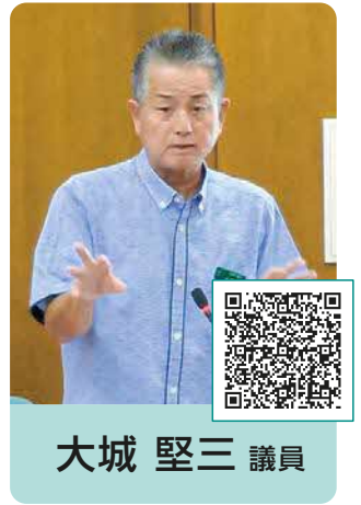
大城 堅三 議員