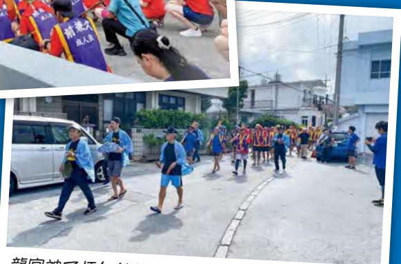
龍宮神で拝んだ後、漁港まで鉦や太鼓を鳴らして 漕ぎ手や住民が練り歩く「道ジュネー」の様子