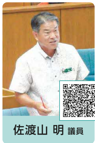
佐渡山 明 議員