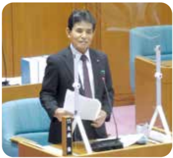
大城 保 議員