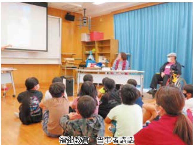
福祉教育 当事者講話