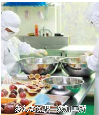
おんなの駅一次加工所

現在、(株)ONNAの取組を支援しながら体制を構築し、将来的には観光とリゾート地としての立地特性を生かした体験型農場等を含め、6次産業化の推進による魅力的な農業展開ができればと考えています。