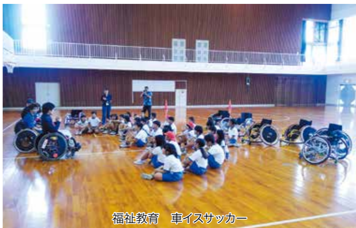
福祉教育 車イスサッカー

提 ボトムアップとして子供達から発進している福祉と今後トップダウンとして村長始め執行部、議員、区長等から発信する福祉が融合することで本村の福祉の充実が期待されます。