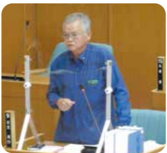
安里 周作 議員