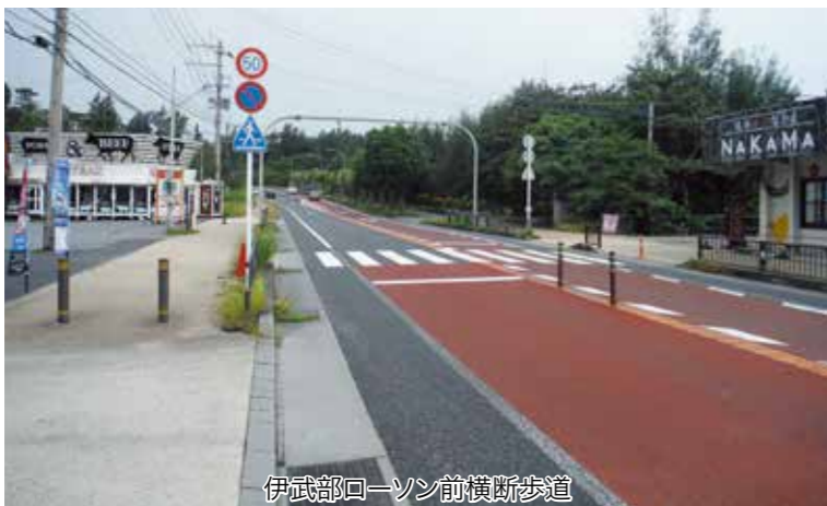
伊武部ローソン前横断歩道

名嘉真区・安富祖区に関しては、バスがないという事もありまして、交通量も多く、そしてまた夜間が、街灯がないということは大変危険な箇所も多いと思ひます。国道58号は、北部国道事務所が管理となっておりますが、村としては、地元からの聞き取りもやって、現場調査なども行って、北部国道事務所への街灯設置の要請を行なっていきたいと考えています。