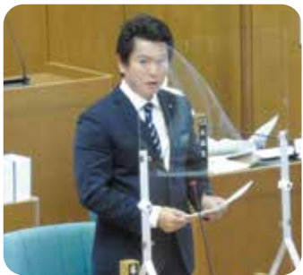
稲村 雅司 議員