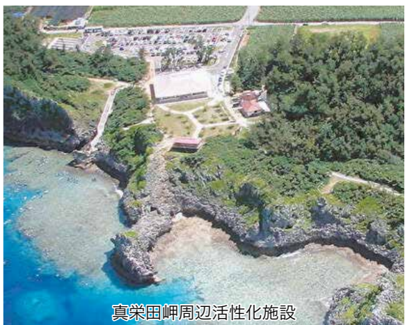
真栄田岬周辺活性化施設

当局も大変重要なことだと考えており、事務引継ぎに関する規程を定めています。他市町村の情報収集して、本村の実態に鑑みた規定の制定に向けて、調査、事務作業中あります。令和5年度の4月1日に施行していければというところで作業を進めています。