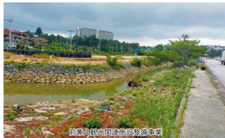
前兼久観光関連施設整備事業

赤間総合運動公園、婦人の家隣の多目的広場、県民の森、農村公園、また自治会の公園、そして公園に類する施設として公民館、団地、ゲートボール場、野球場、運動場で遊具があるとこ