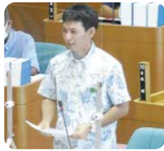
島袋 裕介 議員