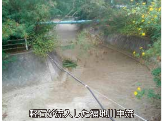
軽石が流入した福地川中流

質 河口閉塞が常態化しており、河川が循環せず汚れている状況です。以前から導流堤の要望もありませんが、今後の計画を伺います。