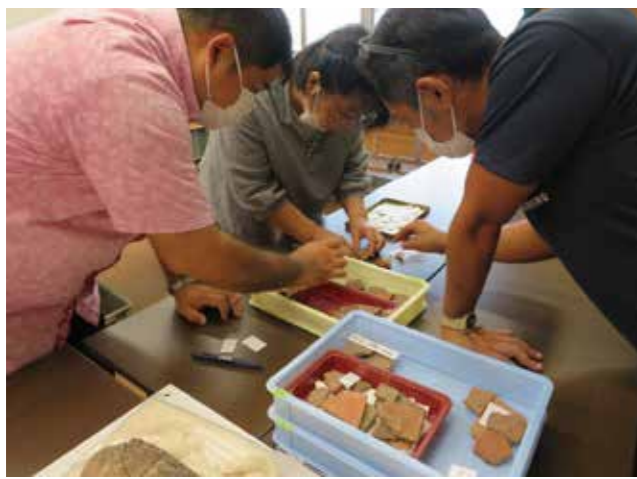
土器調査のようす

恩納村では教育委員会によって発掘調査が行われており、現在進行形で新たな遺跡が発見されています。日々情報が更新されています。考古学ですので、今後、新しい事実が発見されることもあると思います。本書は考古学からみた歴史をなるべく身近に感じていただけるよう