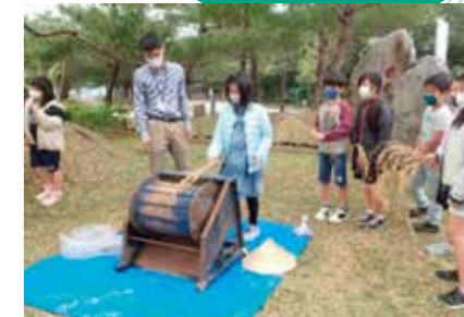
足踏み式脱穀機を使った脱穀体験

現在は新型コロナウイルス感染症対策に配慮して受入れを行っています。大人数を受け入れることが難しい状況ですが、当館ではこれからも村内学校での学習などにも役立てていただけるよう、さまざまな取り組みをしていきたいと思っています。