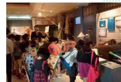
常設展示室見学の様子