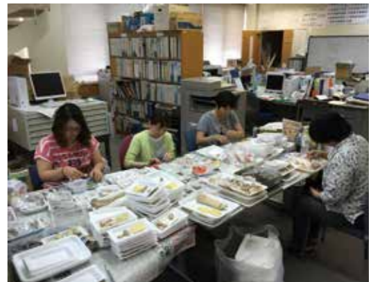
執筆者の方々が獣骨を整理している様子

本書は文化情報センターをはじめ、各公民館、各小、中学校に配布する予定です。また、役場総務課及び博物館で3,000円にて販売予定です。多くの村民のみならず、恩納村の遺跡を身近に感じていただき、教育現場や地域活動で活用していただければ幸いです。村史編さん係では今後さまざまな分野の編集を行ってまいります。現在、調査や資料収集を行っている分野は「戦争編」「歴史編」「民俗編」「芸能編」「言語編」「人物編」「産業編」です。「戦争編」は次に刊行する予定となっております。村民の皆さまが経験されたこ