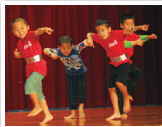
ダンスを披露するチビッコ達

「思 いやり ゆとりは無事故へ つづく道」をスローガンに年末年始交通安全県民運動石川地区出発式が12月18日、コミュニティセンターで開催され、石川署管内の恩納村・金武町・宜野座村・うるま市の交通安全推進関係者や村民約100名が参加しました。