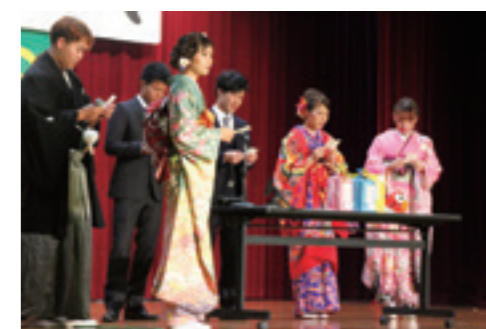
成人式祝賀会実行委員