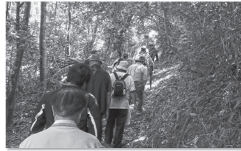
久良波の歴史の道