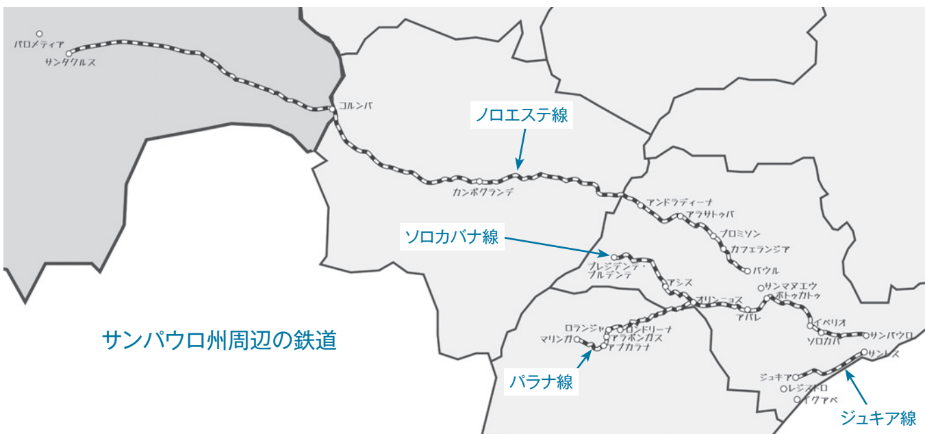
サンパウロ州周辺の鉄道

今回の調査でも列車での移動について語ってくださった方々がいらつしゃいます。日本の約22.5倍の広さを持つブラジルを走る鉄道は私たちの想像を超える労力で作られ、そして多くの移民者の移動に役立てられたことと思います。