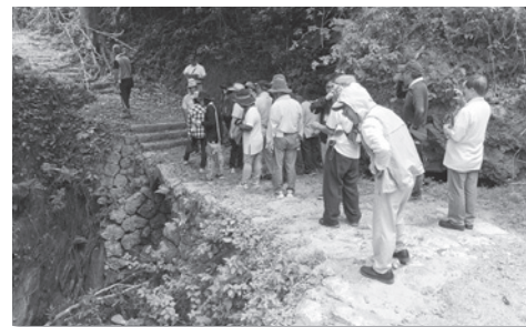
山田谷川(ヤーガー)の石疋