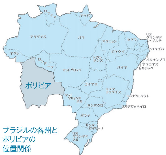
ブラジルの各州とボリビアの位置関係

かつてブラジルを目指したウチナンチュ、ウチナンチュの方々の多くは、長い船旅の後、鉄道を利用して耕地へ移動する際にも鉄道は重要でした。自然と居住地も沿線に広がりました。