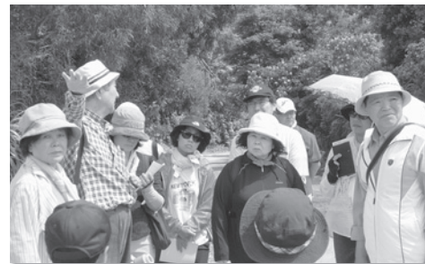
ガイドの説明の様子