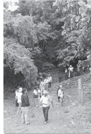
国指定史跡 仲泊遺跡