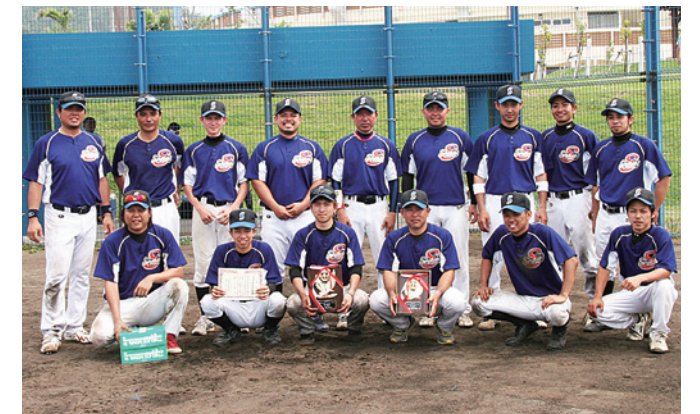
準優勝 瀬良垣体協