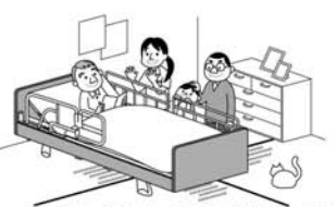
医療・介護ベッド安全普及協議会 出版