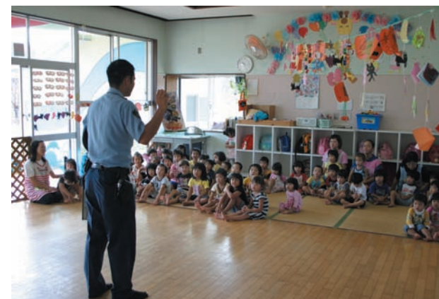
子供たちにいかのおすしの説明をする様子