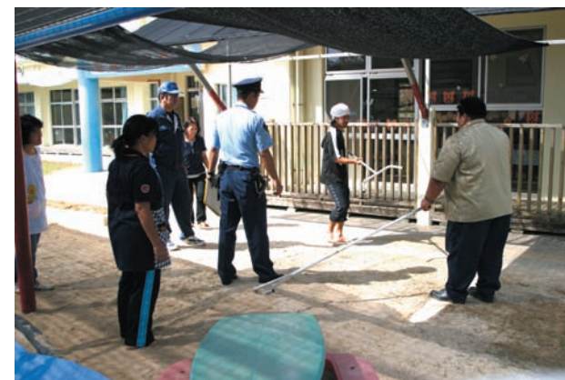
さすまたの使い方を先生方に教える様子