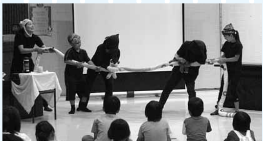
山田小中学校 ルッコラさんによる「はなすもんかー!」