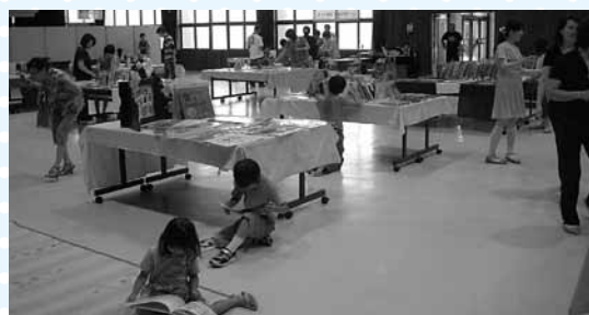
会場の様子 真剣に絵本を読む子どもたち。

7月1日にコミュニティーセンターで第2回移動図書館を行いました。会場では、村内小中学校のボランティア団体によるおはなし会も行われ大変好評を頂きました。