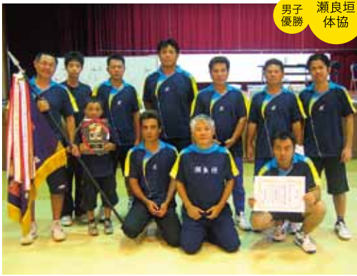
男子優勝 瀬良垣体協

決勝は男女とも昨年と同じ顔合わせとなり、男子は決勝で塩屋体協との接戦を制した瀬良垣体協が、女子は決勝で仲泊体協を制した山田体協が共に、二年連続二度目の優勝をはたしました。