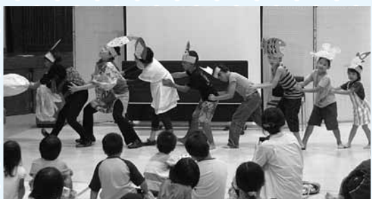
仲泊小中学校 ルピナスさんによる「おおきなかぶ」の実演