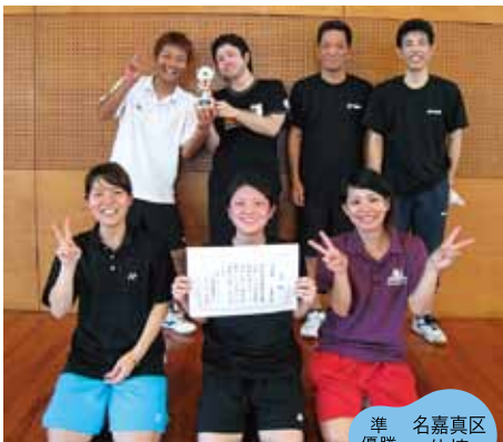
準優勝 名嘉真区体協