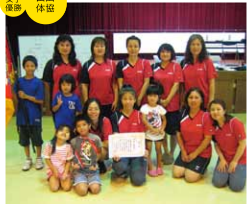
女子優勝 山田体協

男子優勝―瀬良垣、準優勝―塩屋、三位―前兼久、四位―安富祖、五位―山田、六位―恩納。 女子優勝―山田、準優勝―仲泊、三位―塩屋、四位―前兼久、五位―恩納、六位―安富祖。