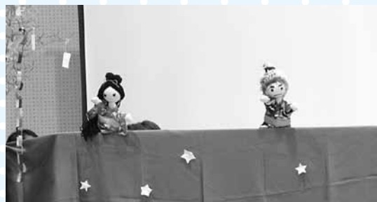
恩納小中学校 おはなしばこさんによる人形劇