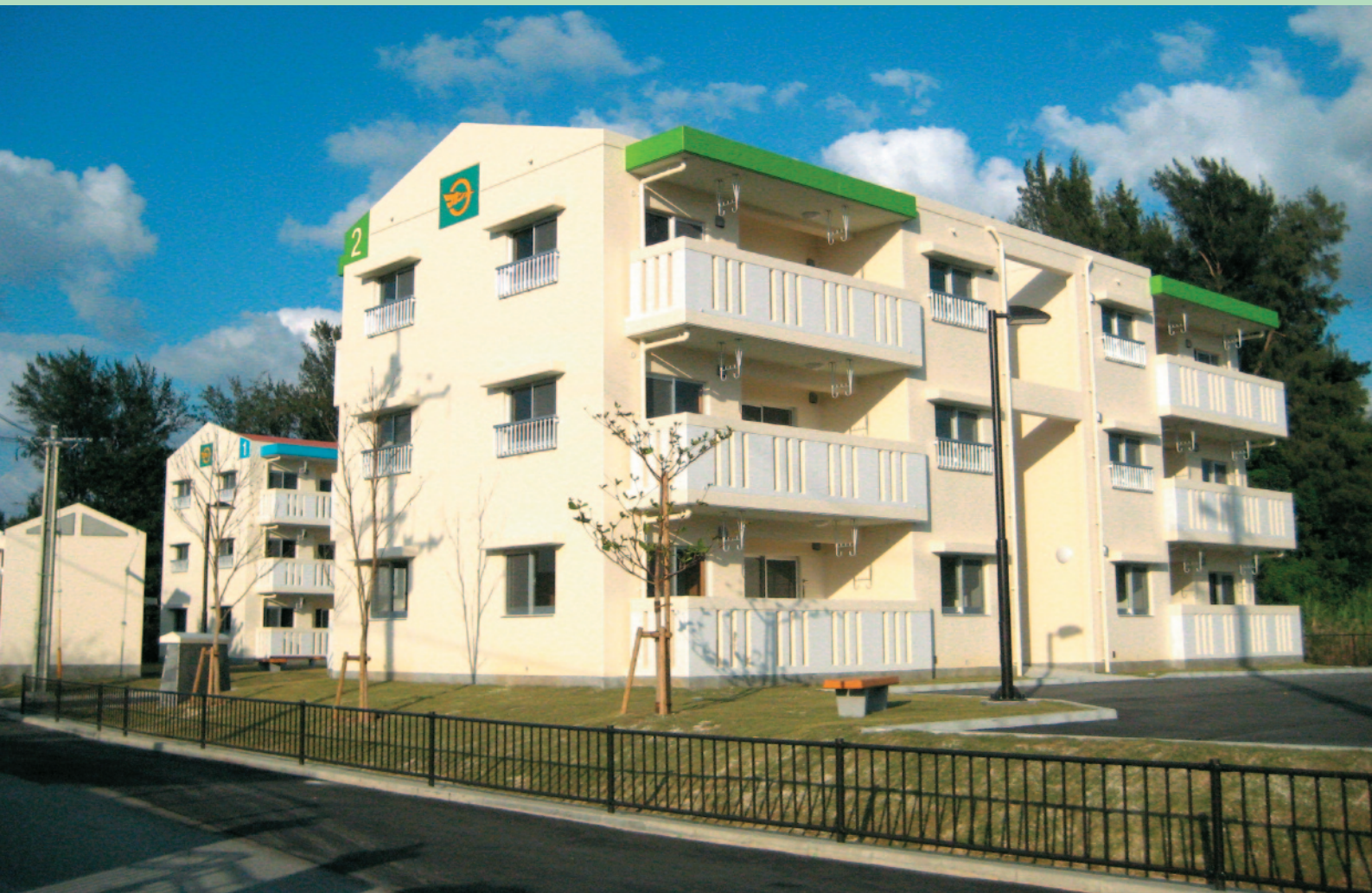
▲ 10月末に完成した村営塩屋団地の外観

広報おんな 12月号 (No.354) 発行/恩納村 〒904-0492 沖縄県国頭郡恩納村宇恩納2451番地 編集/総務課 ☎(998) 966-1200 FAX (998) 966-2779 http://www.vill.onna.okinawa.jp