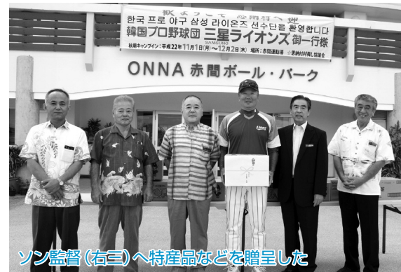
ソン監督(右三)へ特産品などを贈呈した

問い合わせ：JA恩納支店 経済課 TEL 098-966-8251 FAX 098-966-8574