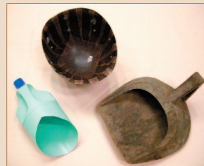
村博物館 電話: 982-5112

戦前は松の木を削って作られていましたが、戦後になると米軍から払い下げられたヘルメットや洗剤の容器を加工して作られるようになりました。材料の移り変わりを博物館第1展示室で確認してみてください。