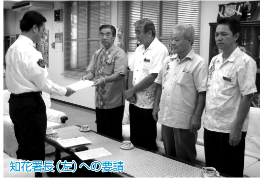
知花署長(左)への要請