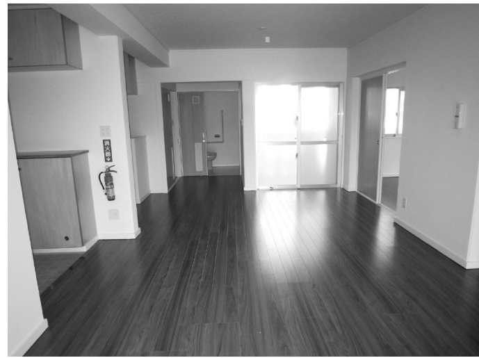
▲ 村営塩屋団地の内観 ▼