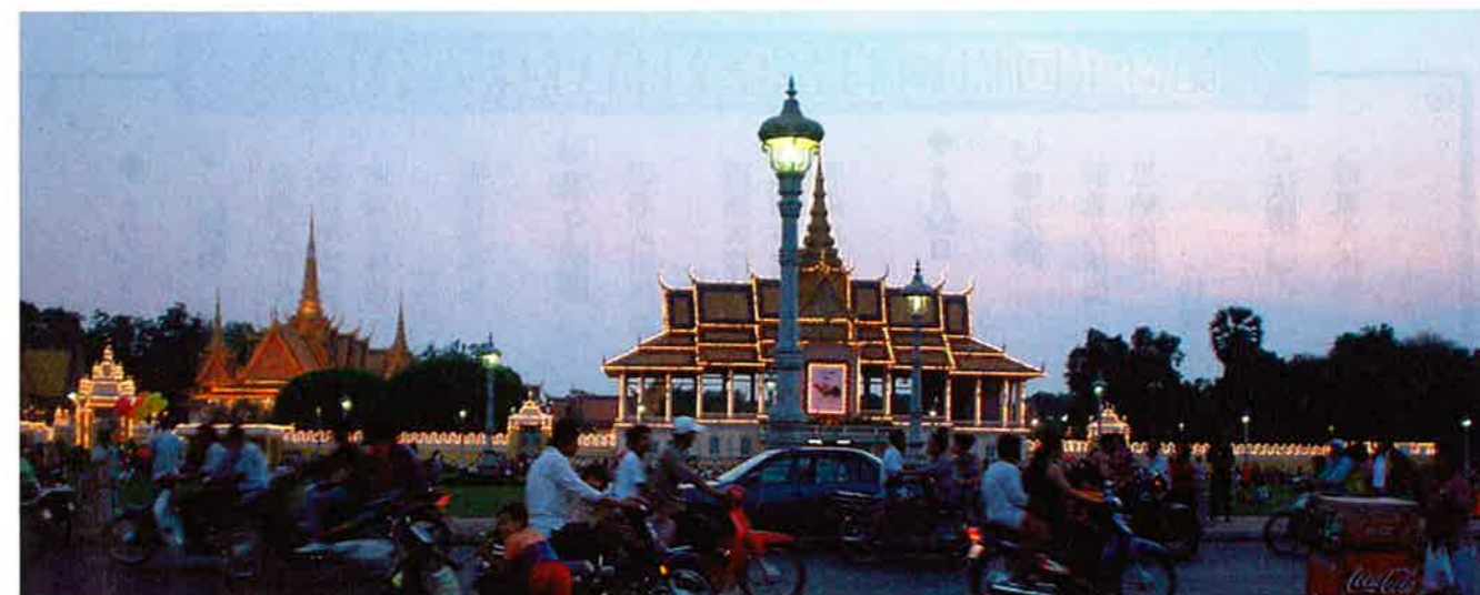
▲ トンレサップ川沿いの王宮。正月期間はその王宮も特別にライトアップされ、夕方から周辺には人だかりが増してくる。

その次はチャイニーズニューイヤー(中国正月)と呼ばれ、日本でいう旧正月です。今年は2月9日でした。ここは中国人の血も混ざっている方が多く、職場を休んで中国正月を迎える方もいます。主に中国の様式を取り入れ、31日は家でお祈りをし、料理を作ってお供えします。元旦は大掃除をし、1日はどこへも行かず家族で家で過ごし、2日目から外出します。そしてお年玉を子供やお