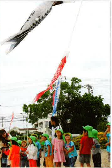
▲ 掲揚されたこいのぼりを見上げる園児