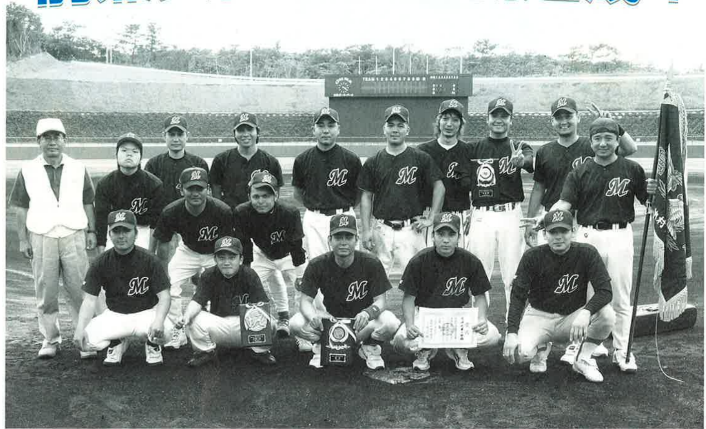
▲ 優勝した前兼久体協