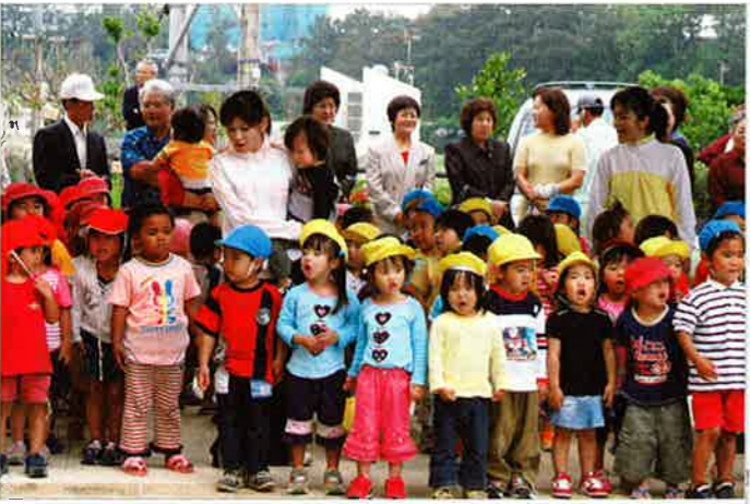
▲ こいのぼりの歌を元気に歌う園児

子どもの日と児童福祉週間にあわせて、4月22日、恩納村役場玄関前で毎年恒例のこいのぼり掲揚式が行われました。 村内の村立・私立保育所の園児ら122人が参加して、こいのぼりの歌やチューリップ、幸せなら手を叩こうを元気に歌い、みんなで一斉に47匹のこいのぼりを掲揚しました。こいのぼりは大空を気持ちよく泳いでいます。