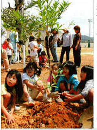
▲ 恩納小学校グラウンドでホルトの木を植樹する子どもたち