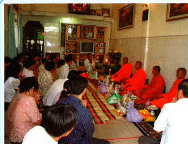
▲ 職場の同僚の家。クメール正月は家に親戚や職場の同僚を招き、お坊さんを迎えて供養をしてもらう。約2時間行事が終わった後、参列者に食事を接待する。