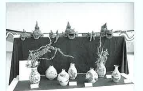
▲ゆかいなシーサーたちと元気そうに泳ぐ魚の模様の焼き物たち