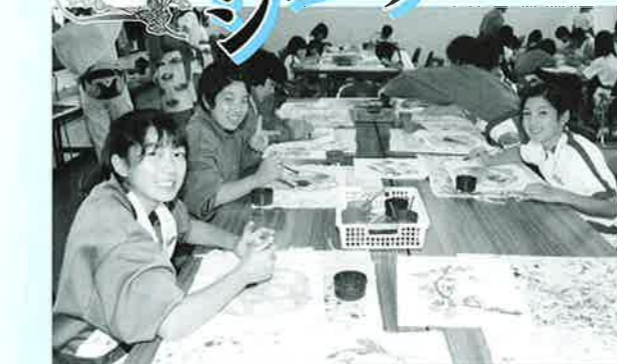
▲楽しそうに紅型に色づけするこどもたち