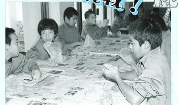
▲赤い粘土をコネコネ。どんなシーサーができるかな?