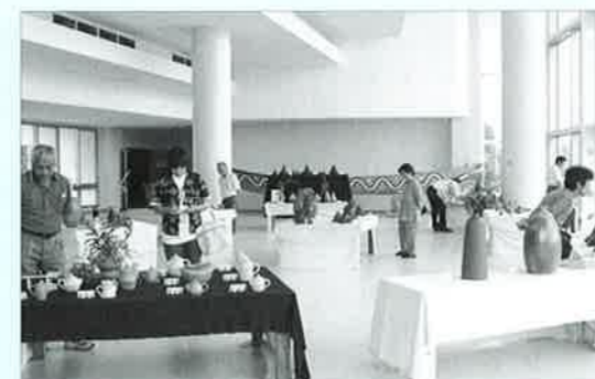
▲博物館のロビーで開催されたやちむん展には多くの方が来場しました。