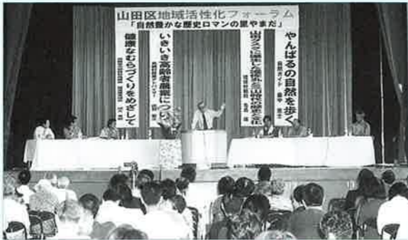
▲山田区で開催された地域活性化フォーラム

地域のことは自分達で考えて、地域の活性化に努めようという目的で、山田区地域活性化フォーラム(100名参加)が、山田区児童体育館で開催されました。将来を見据えた山田区の基本構想を策定するため、3年前に山田区地域活性化基本構想策定委員会を設置し、現地踏査や区民対象の山田の宝さがし、アンケート調査と、段階的に作業を進めながらこの度の区民フォーラムを開催することができました。