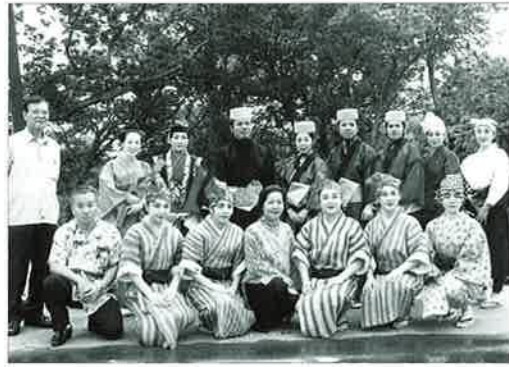
▲ 大山町を訪問した恩納村文化協会のみなさん