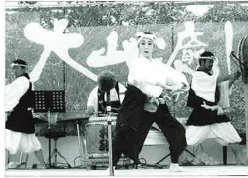
▲ 大山町のみなさんの太鼓と琉舞の見事なコラボレーション!