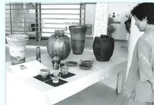
▲さまざまな形や色の焼き物たちを興味深そうに見つめる来館者