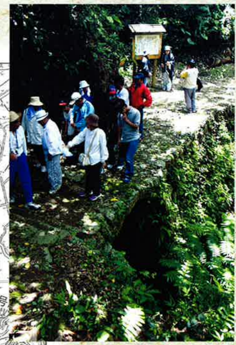
◀山田谷川の石砦（国指定史跡へ） 山田グスク（城）北側崖下を流れる谷川に架けられている石砦。琉球石灰岩でできており、中央部がせり上がり、独特なアーチ形式のものである。現在の石砦は既存の石4枚を組み合わせて修復したものである。