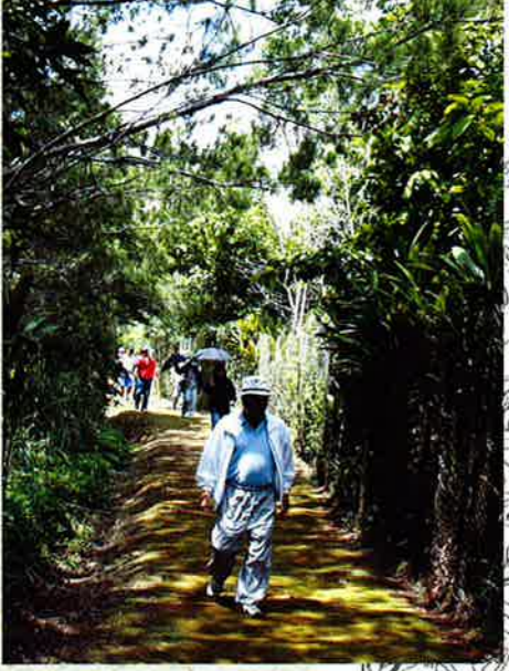
▶寺川砦付近の里道。地面にはコケが生い茂り、油断するとツルつとすべるため、参加者の足取りもそろそろりそろりと

▶真栄田の一里塚（国指定史跡へ） 多幸山山中（真栄田区内側）を通る宿道沿いに造られており、人工による盛土である。一里塚は一対でこの真栄田の一里塚は西側にある。東側は畑地開墾により失われたが、その形だけは簡単に付近に盛土してある。村内には5箇所の一里塚があったが、仲泊と真栄田のもののみ残っている。また、県内でも一里塚間を示す2箇所の一里塚が残っているのは恩納村だけであり、貴重な交通遺跡となっている。