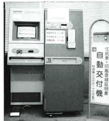
▲ 恩納村博物館1階資料閲覧室に設置してある自動交付機

***** ☆自動交付機を利用するには 自動交付機を利用するには「恩納村ナビカード」の交付を恩納村役場村民課で申請して、暗証番号の登録の届出が必要になります。 ☆暗証番号の登録 暗証番号の登録や変更は、必ず本人に届出をしてもらい、本人確認後登録します。 (本人の確認は運転免許証等、顔写真入の身分証明で確認します。) (身分証明等を提示できない方は、村内で印鑑登録をされている方に保証人になってもらいます。) 詳しくは村民課までお問い合わせください。 *****