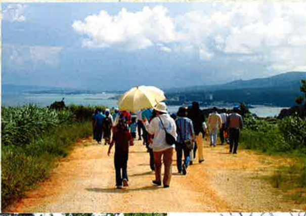
▶真栄田の一里塚から東シナ海を望みながら一行は次の史跡へ。強い日差しの中、仲むつまじく日傘をさして史跡めぐり