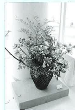
▲籐カゴ?いいえ、網目を一彫り、一彫りていねいに仕上げた焼き物なんです!