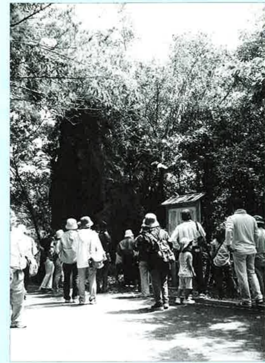
▲ フェーレー岩 多幸山山中は国頭方西海道の中でも難所の一つとされていた。昼でも薄暗く、フェーレー(山賊)が出没したといわれ、当時、行き交う人々に恐れられていた場所でもある。中でもこの岩近辺は、フェーレーが下を通る人の荷物を吊るし上げて奪ったという伝説が残っている。